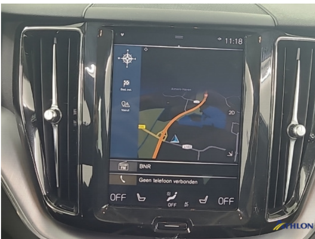
Navigatie of radio