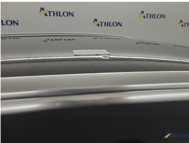
1. Dak Deuk/deuken