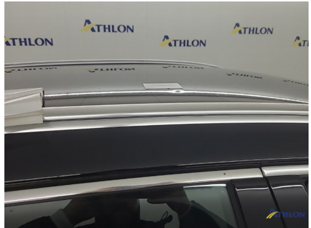
1. Dak Deuk/deuken