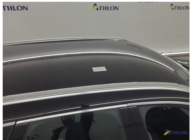
1. Dak Deuk/deuken