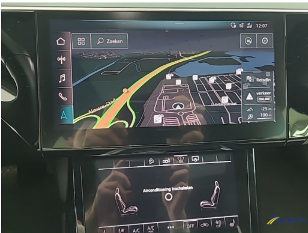
Navigatie of radio