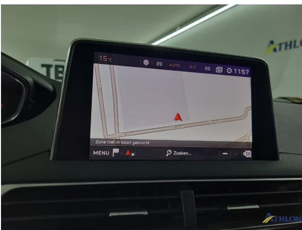
Navigatie of radio