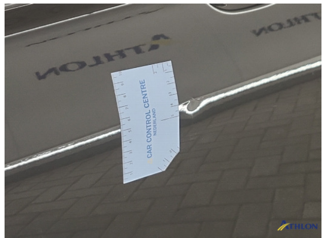
1. diverse Gebruikssporen