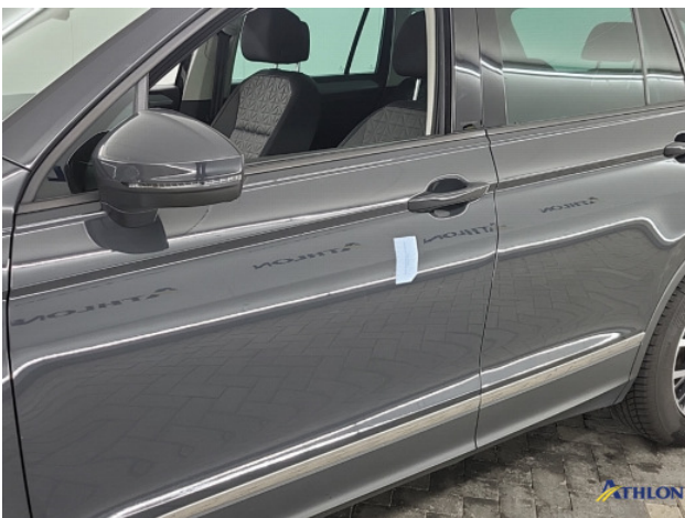
1. diverse Gebruikssporen