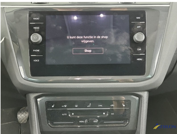
Navigatie of radio