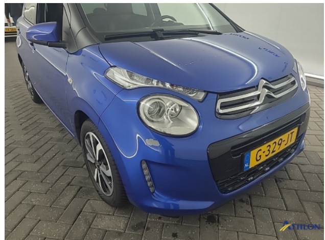
1. diverse Beschadigd