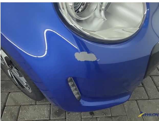
1. diverse Beschadigd