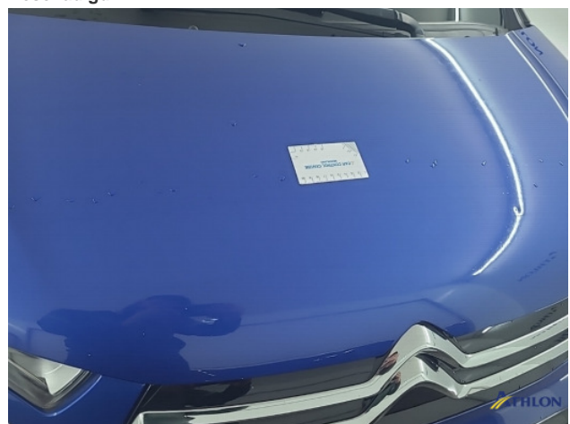
1. diverse Beschadigd