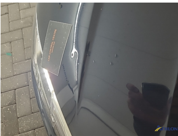
1. Motorkap Deuk/deuken