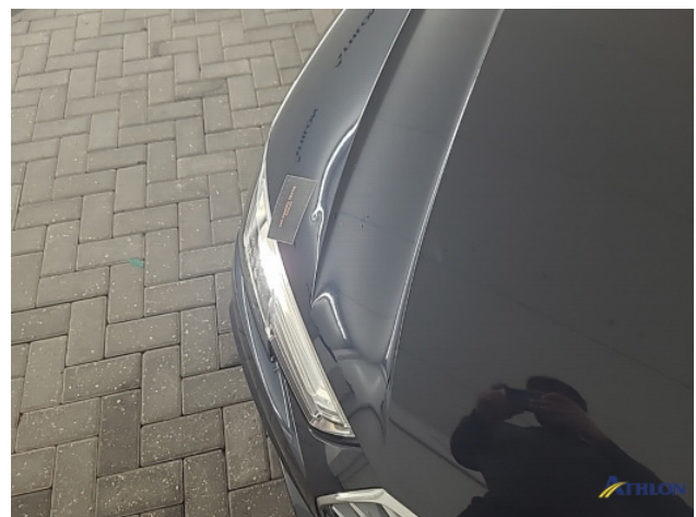
1. Motorkap Deuk/deuken