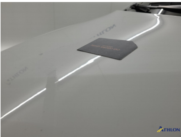
3. diverse schades Gebruikssporen