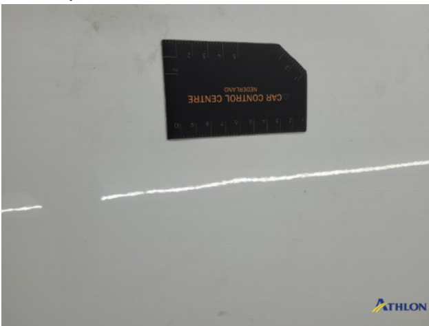
3. diverse schades Gebruikssporen