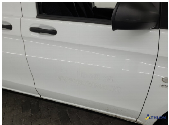
4. lijmresten verwijderen Gebruikssporen