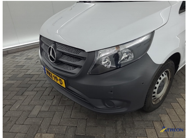
1. Voorbumper Krassen