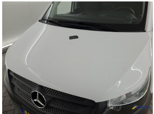
3. diverse schades Gebruikssporen