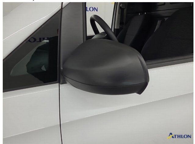
3. diverse schades Gebruikssporen