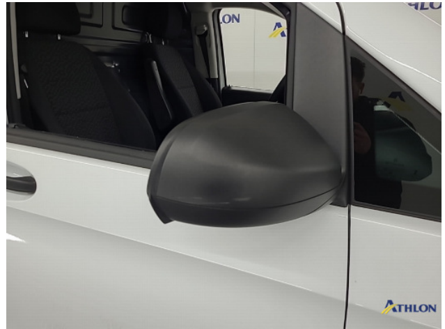
2. Spiegelbehuizing - rechts Krassen