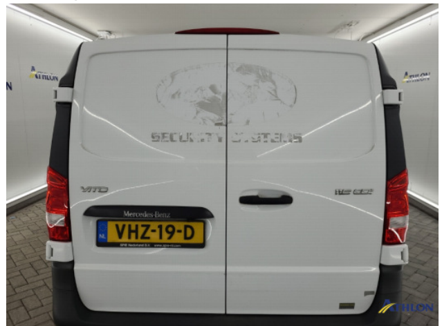
4. lijmresten verwijderen Gebruikssporen