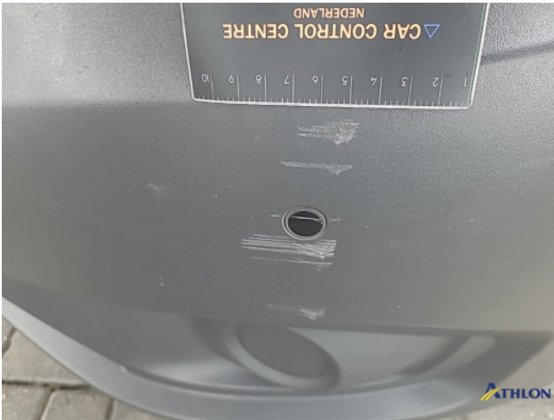
1. Voorbumper Krassen