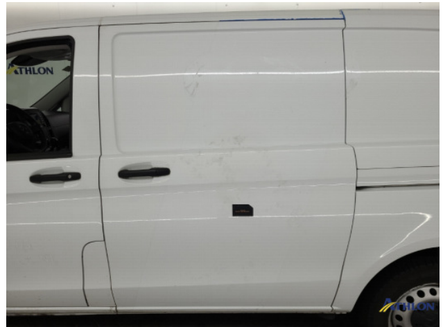
3. diverse schades Gebruikssporen