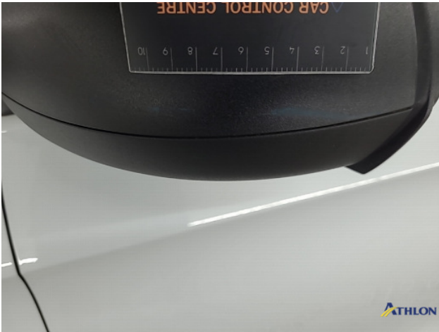
3. diverse schades Gebruikssporen