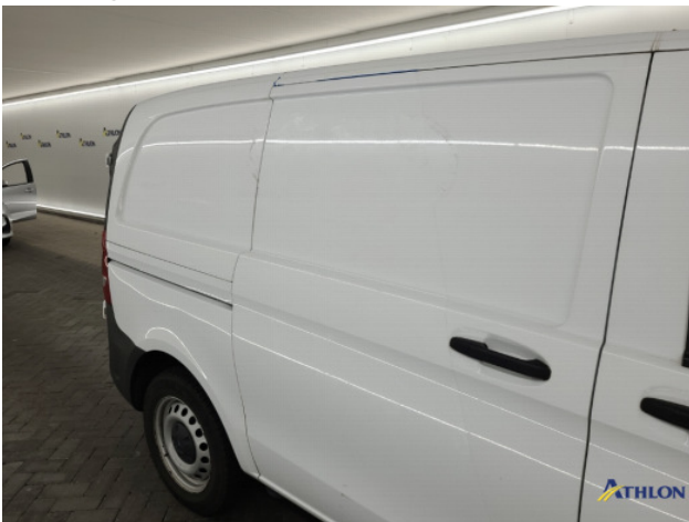
4. lijmresten verwijderen Gebruikssporen