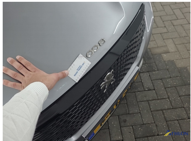
1. diverse Krassen