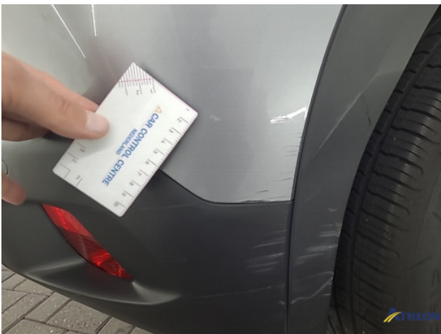
1. diverse Krassen