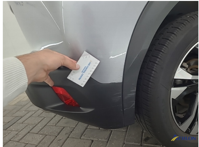
1. diverse Krassen