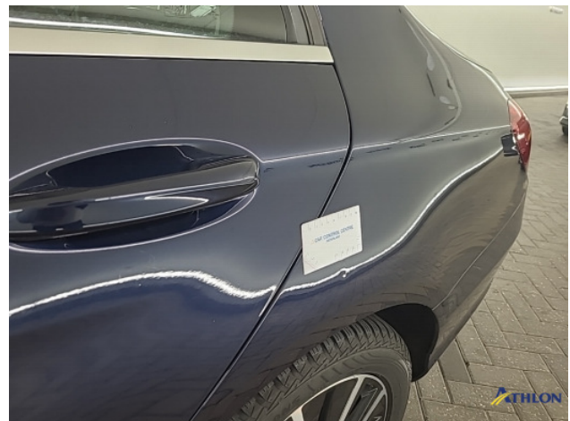
1. Zijwand - achter - Links Deuk/deuken