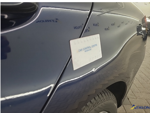
1. Zijwand - achter - Links Deuk/deuken