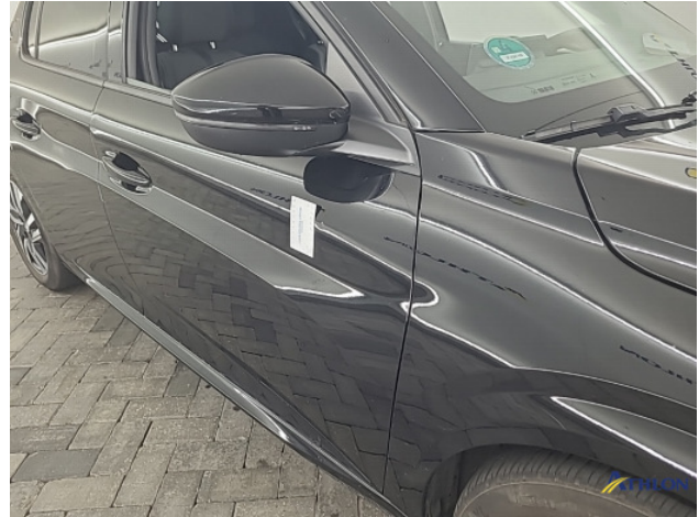
1. diverse Deuk/deuken