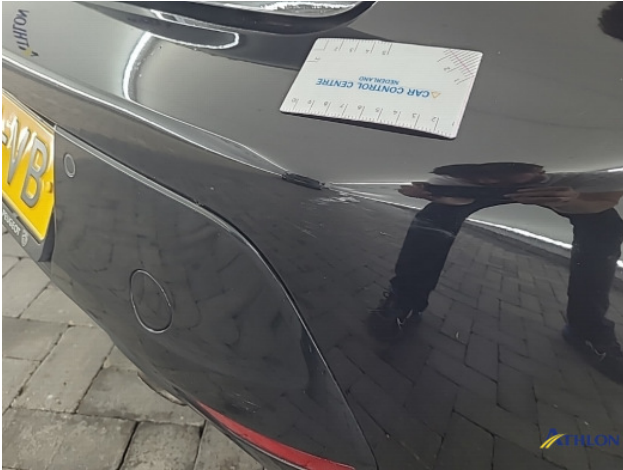
1. diverse Deuk/deuken