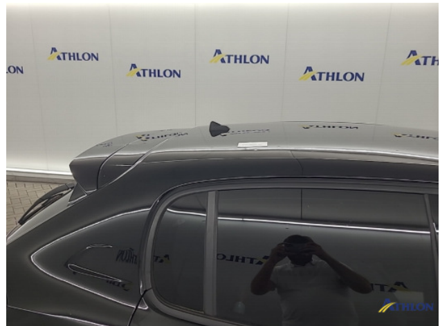
1. diverse Deuk/deuken