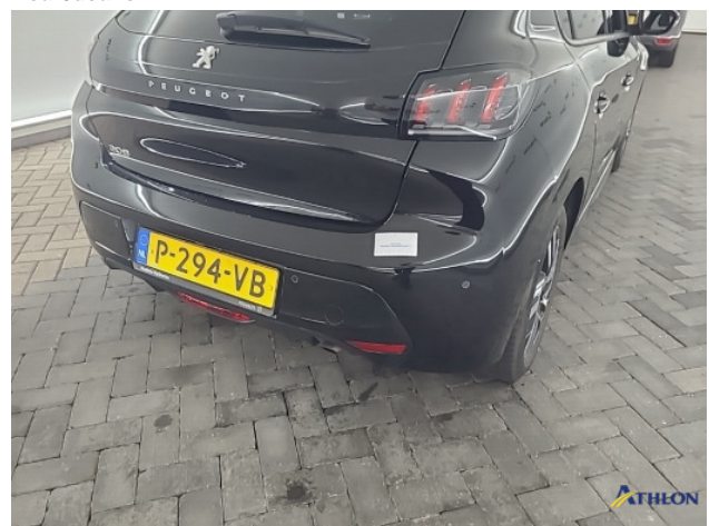
1. diverse Deuk/deuken