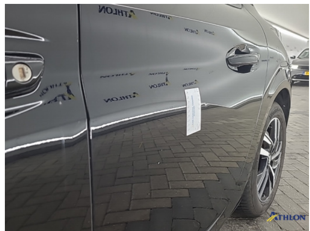
1. diverse Deuk/deuken