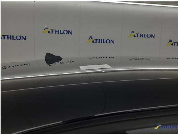
1. diverse Deuk/deuken