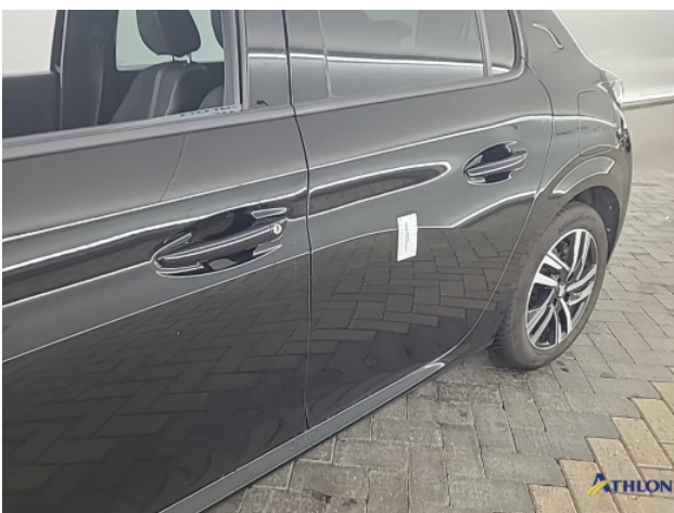
1. diverse Deuk/deuken