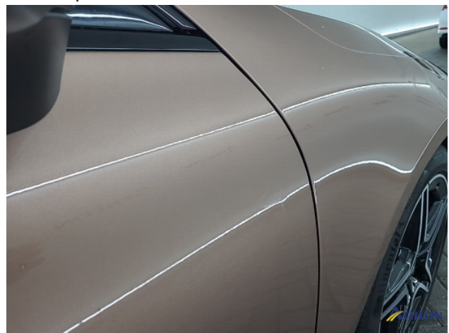
2. diverse Gebruikssporen