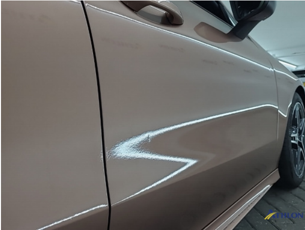
2. diverse Gebruikssporen