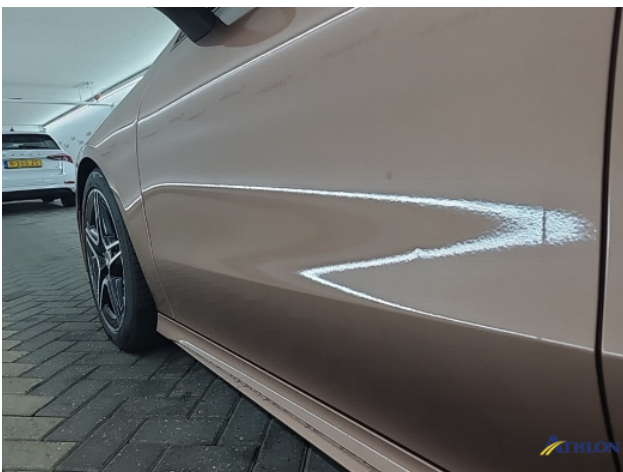
2. diverse Gebruikssporen