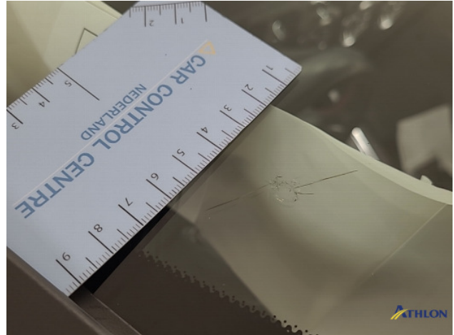
1. Voorruit Barst