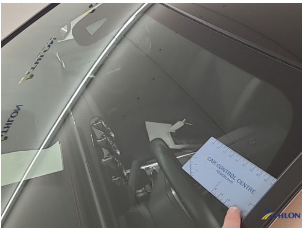
1. Voorruit Barst