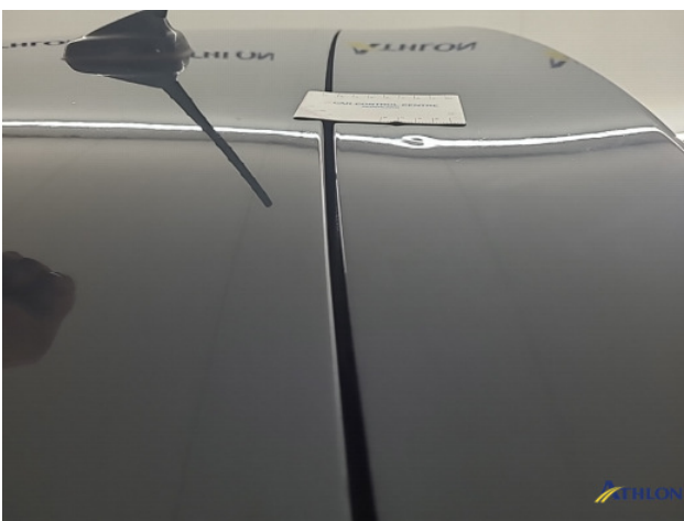
1. diverse Deuk/deuken