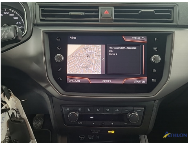
Navigatie of radio