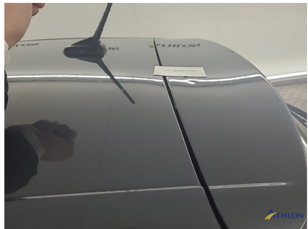
1. diverse Deuk/deuken