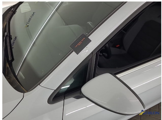
1. Dakframe - links Krassen