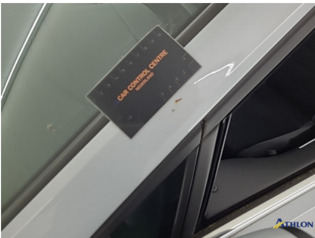
1. Dakframe - links Krassen