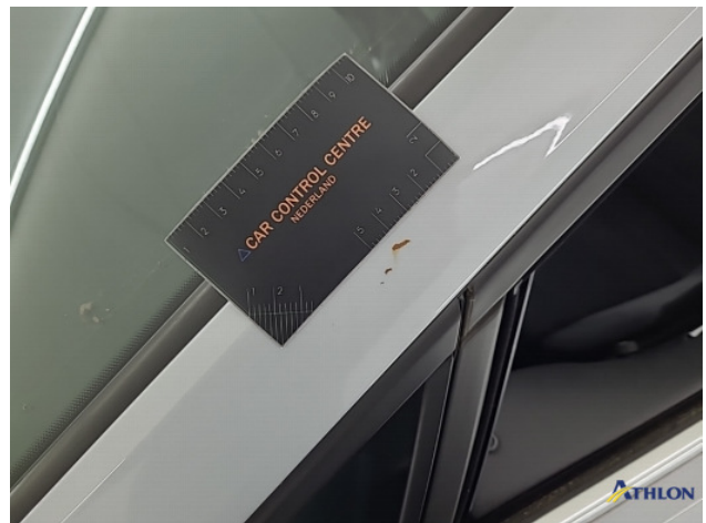
1. Dakframe - links Krassen