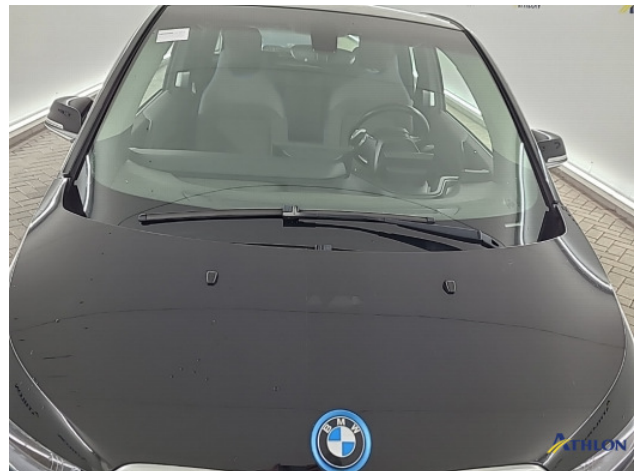
1. Ontstickeringsresten Gebruikssporen