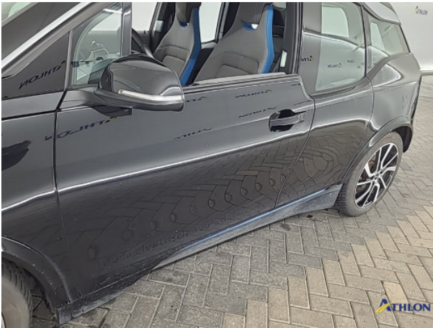
1. Ontstickeringsresten Gebruikssporen