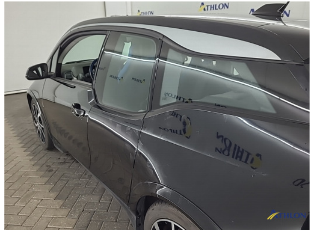
1. Ontstickeringsresten Gebruikssporen