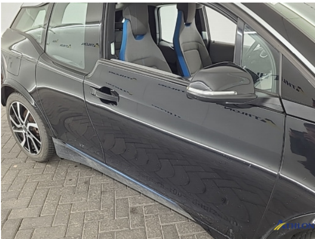
1. Ontstickeringsresten Gebruikssporen