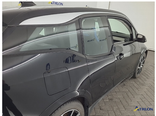
1. Ontstickeringsresten Gebruikssporen