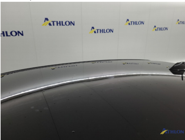
1. Ontstickeringsresten Gebruikssporen