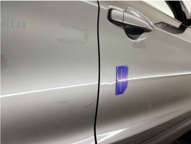
1. Portier voor - rechts