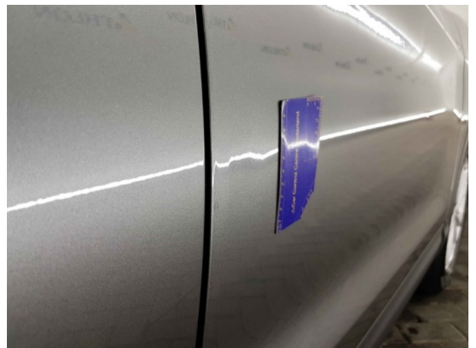
1. Portier voor - rechts