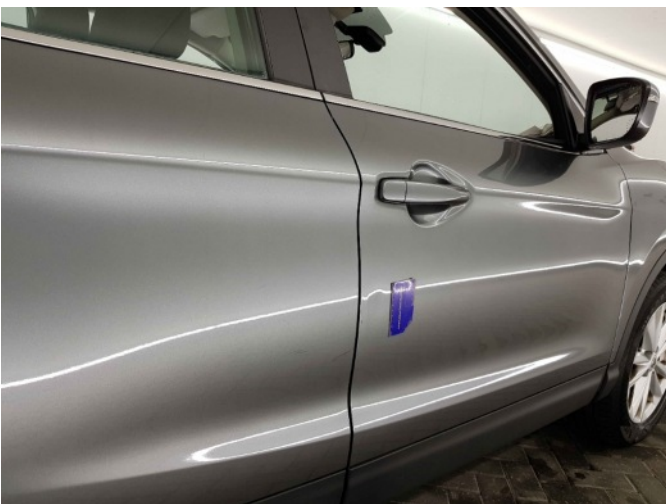
1. Portier voor - rechts