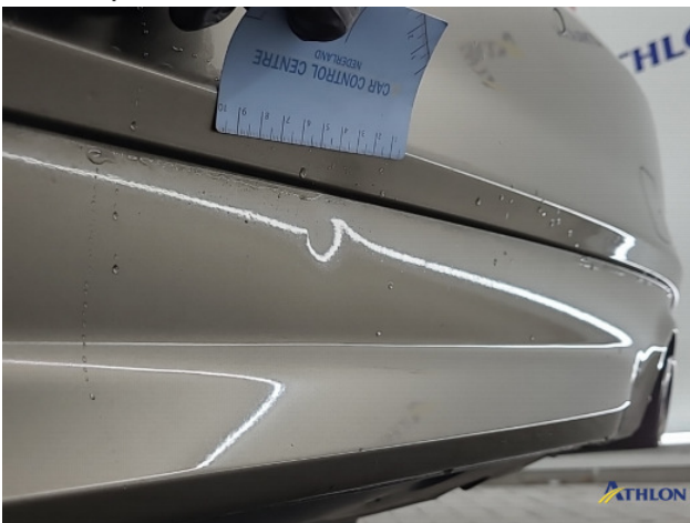
4. diverse Gebruikssporen