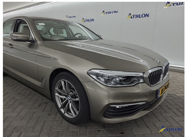
4. diverse Gebruikssporen