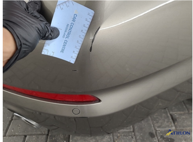
2. Achterbumper Krassen