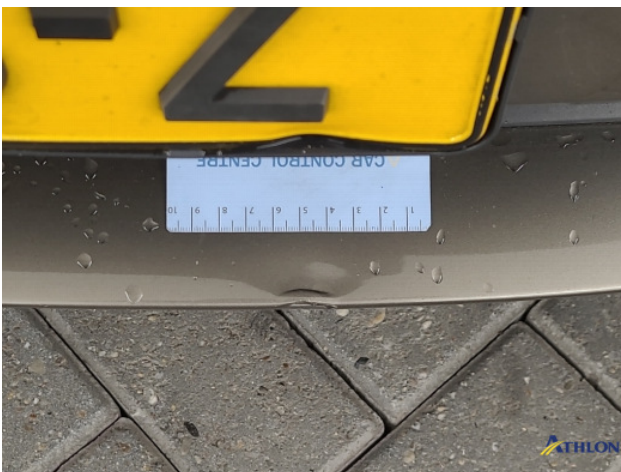
3. Voorbumper Gebruikssporen