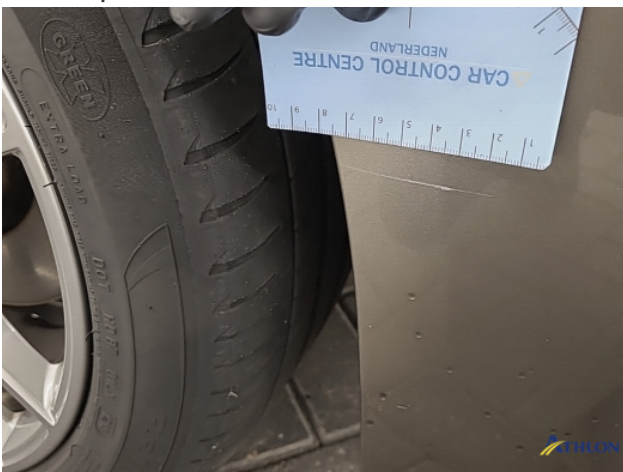
4. diverse Gebruikssporen