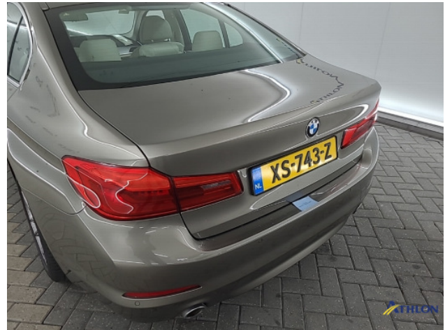
4. diverse Gebruikssporen