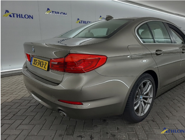
2. Achterbumper Krassen