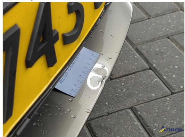
3. Voorbumper Gebruikssporen