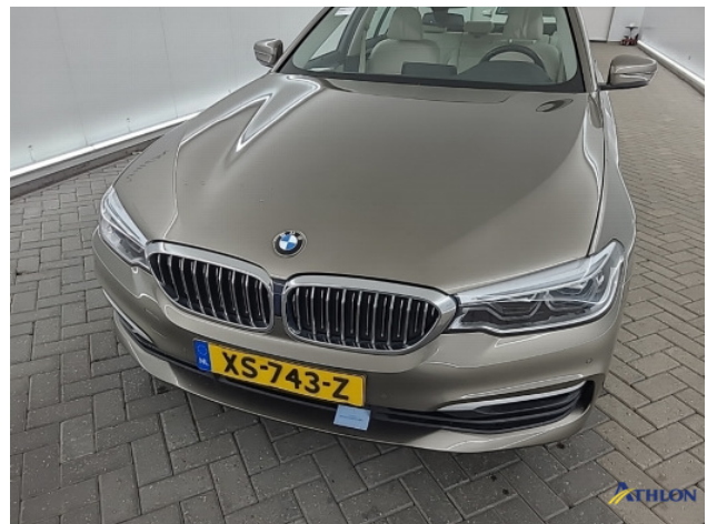
3. Voorbumper Gebruikssporen