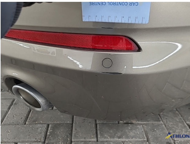
2. Achterbumper Krassen