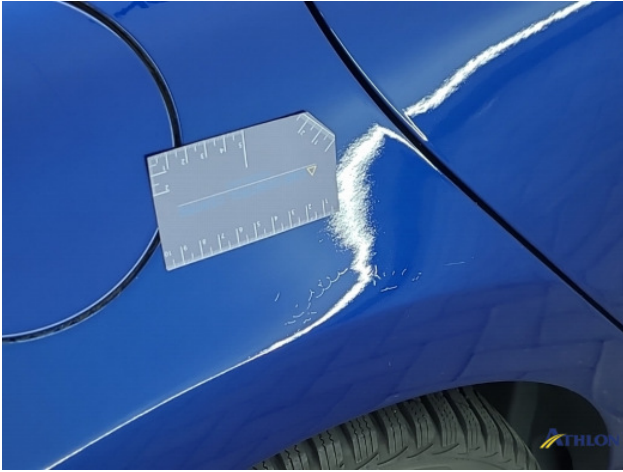
2. Oneffenheden lak/kleurverschil Gebruikssporen