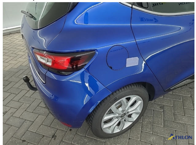
2. Oneffenheden lak/kleurverschil Gebruikssporen