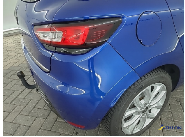
2. Oneffenheden lak/kleurverschil Gebruikssporen