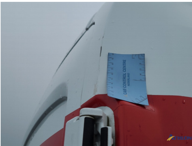
3. diverse Gebruikssporen