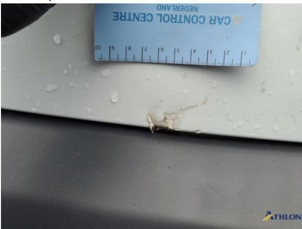
3. diverse Gebruikssporen