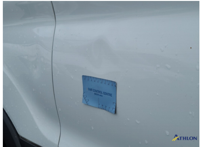
2. Portier achter - rechts Deuk/deuken