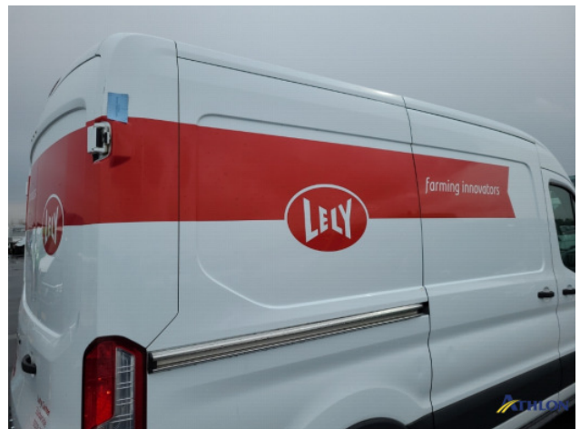
3. diverse Gebruikssporen