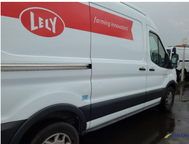
1. Zijwand - achter - rechts Deuk/deuken