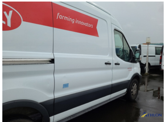
2. Portier achter - rechts Deuk/deuken