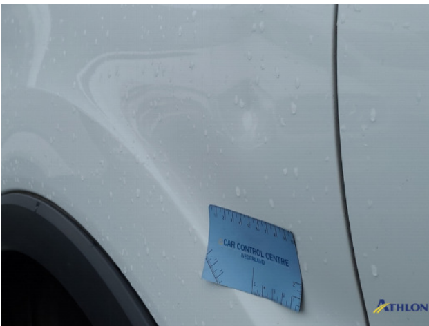
1. Zijwand - achter - rechts Deuk/deuken