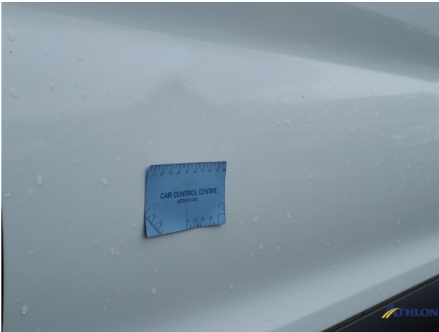
2. Portier achter - rechts Deuk/deuken