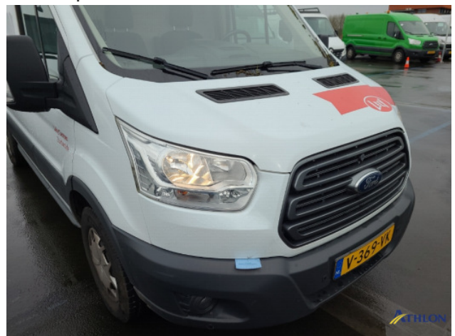
3. diverse Gebruikssporen