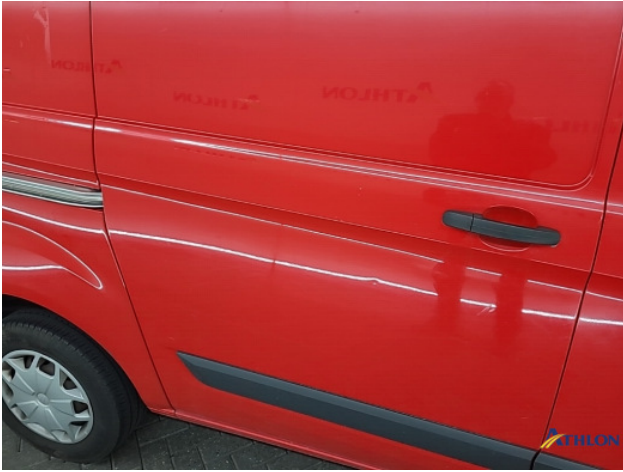
4. diverse Gebruikssporen