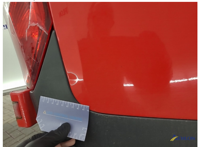
5. Achterlicht rechts Breuk / barst / scheur