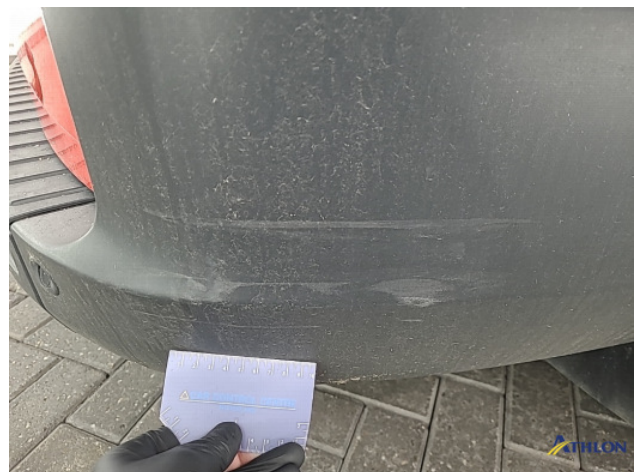
5. Achterlicht rechts Breuk / barst / scheur