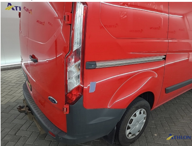
5. Achterlicht rechts Breuk / barst / scheur