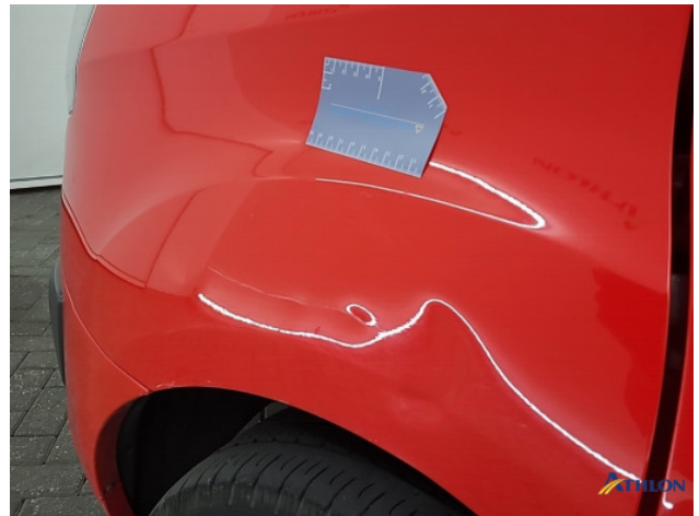
1. Voorscherm - links Deuk/deuken