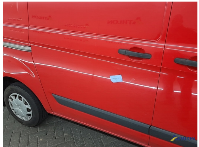
2. Portier achter - rechts Deuk/deuken