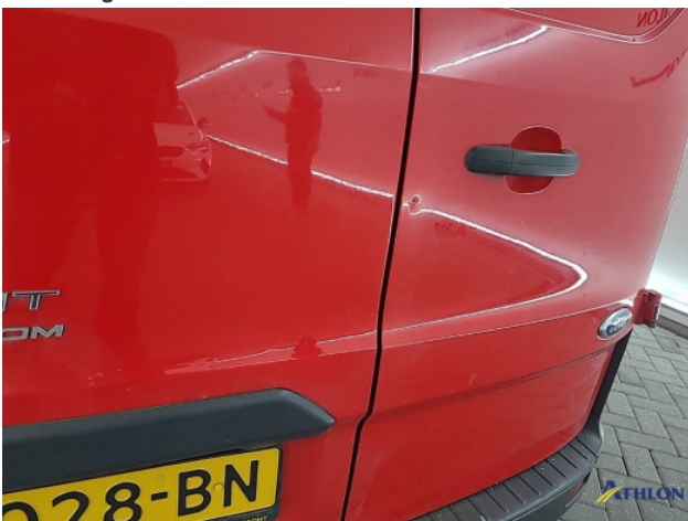
4. diverse Gebruikssporen