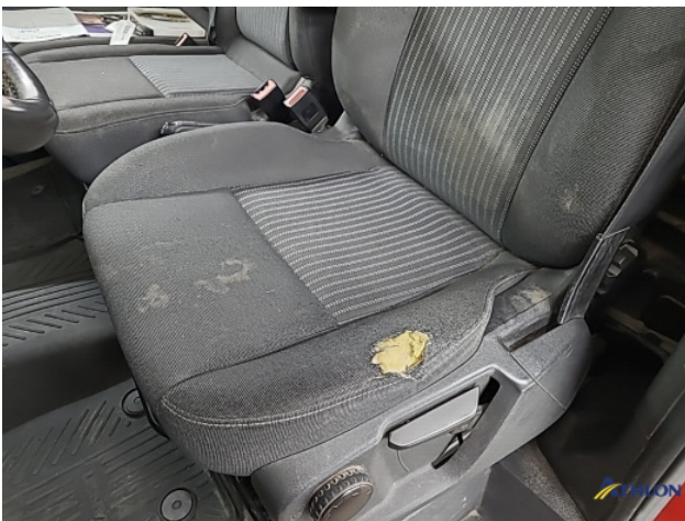
3. Iv stoel Beschadigd