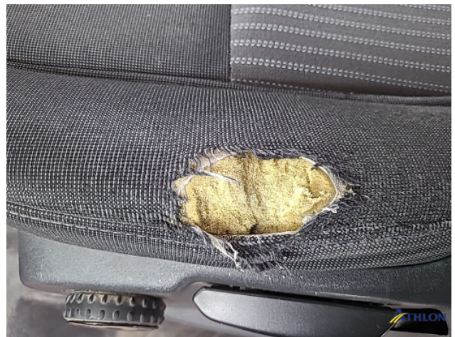
3. Iv stoel Beschadigd