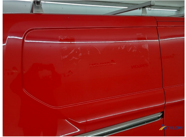
4. diverse Gebruikssporen