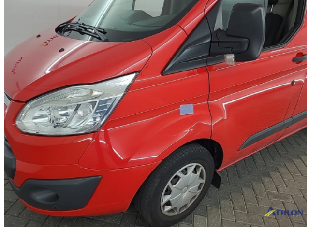
1. Voorscherm - links Deuk/deuken