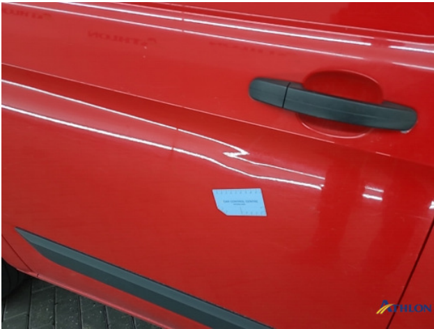
2. Portier achter - rechts Deuk/deuken