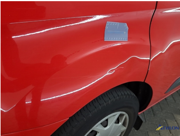
1. Voorscherm - links Deuk/deuken