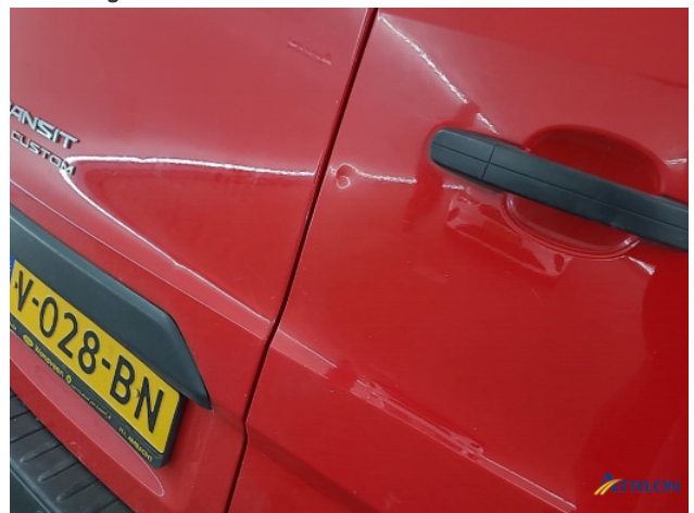
4. diverse Gebruikssporen