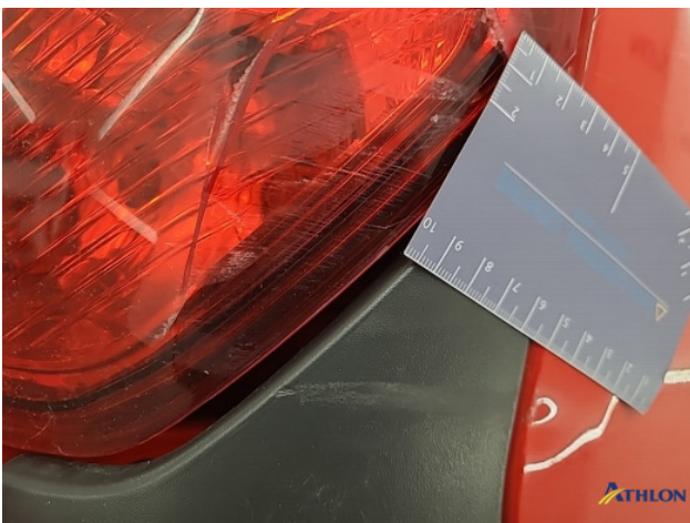
5. Achterlicht rechts Breuk / barst / scheur