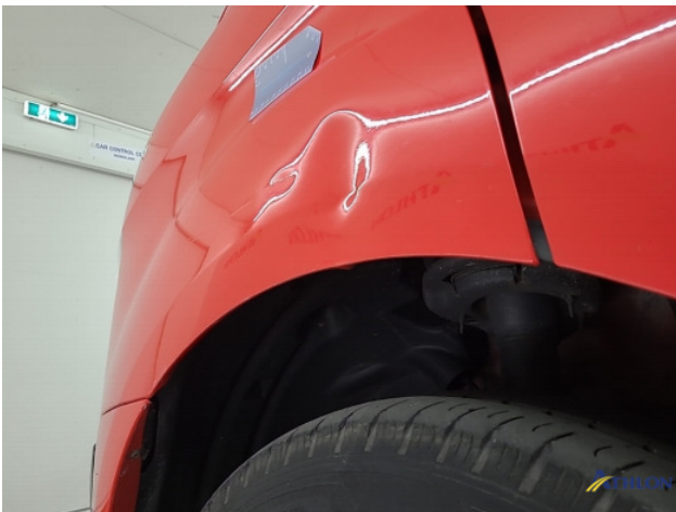
1. Voorscherm - links Deuk/deuken