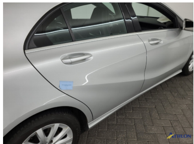
1. Oneffenheden lak Gebruikssporen