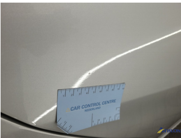
1. Oneffenheden lak Gebruikssporen