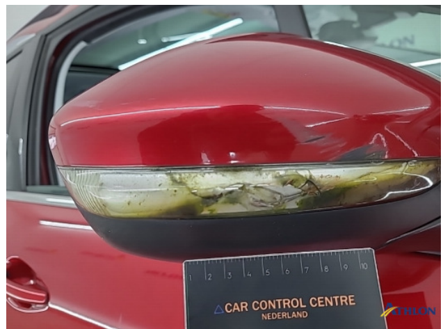
1. Spiegelbehuizing - rechts Breuk / barst / scheur