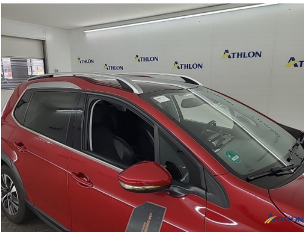
1. Spiegelbehuizing - rechts Breuk / barst / scheur