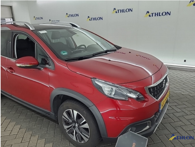
2. Voorbumper Krassen