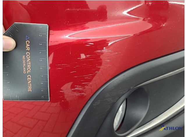
2. Voorbumper Krassen