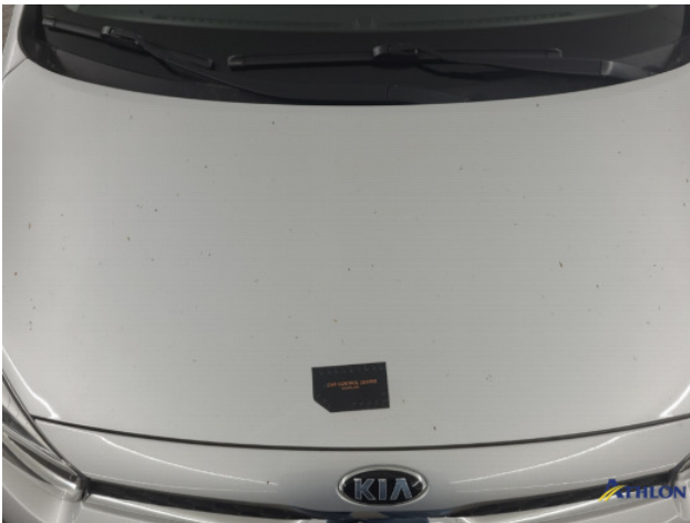
1. diverse schades Gebruikssporen