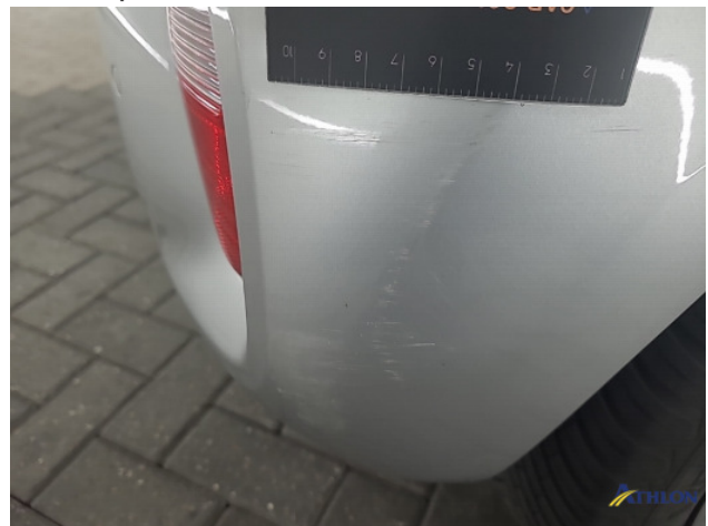
1. diverse schades Gebruikssporen