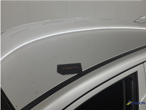
1. diverse schades Gebruikssporen