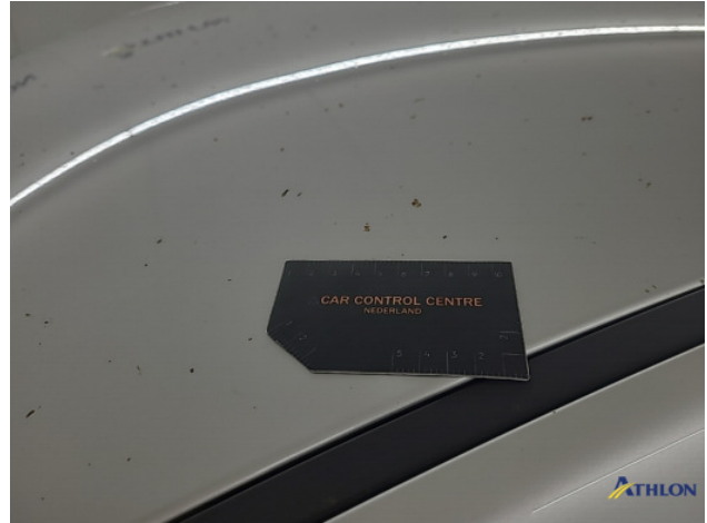
1. diverse schades Gebruikssporen