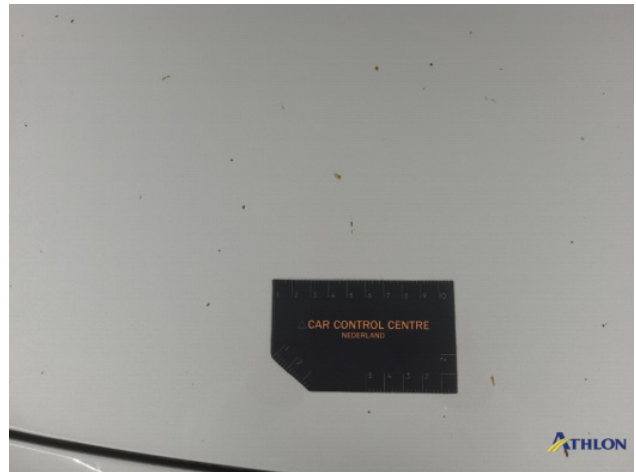
1. diverse schades Gebruikssporen