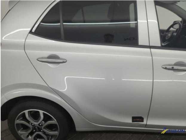
1. diverse schades Gebruikssporen