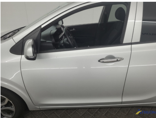
1. diverse schades Gebruikssporen