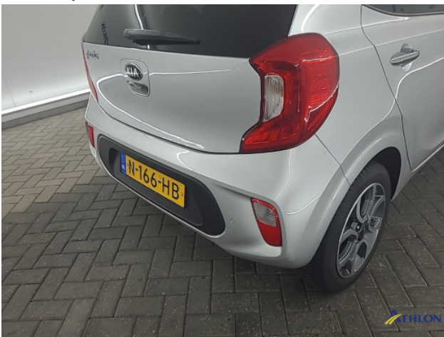
1. diverse schades Gebruikssporen