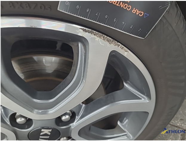
1. diverse shades Gebruikssporen