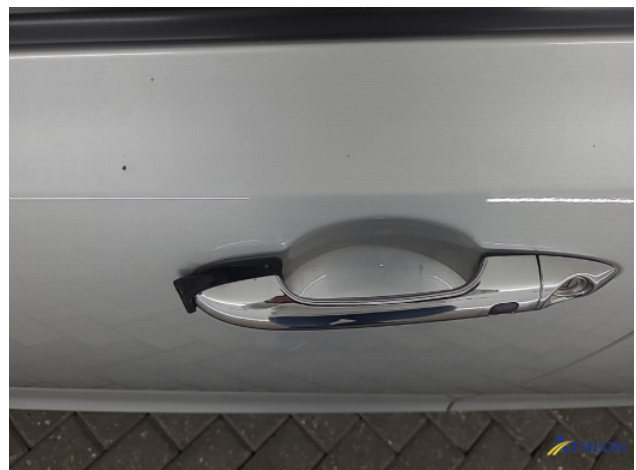
1. diverse schades Gebruikssporen