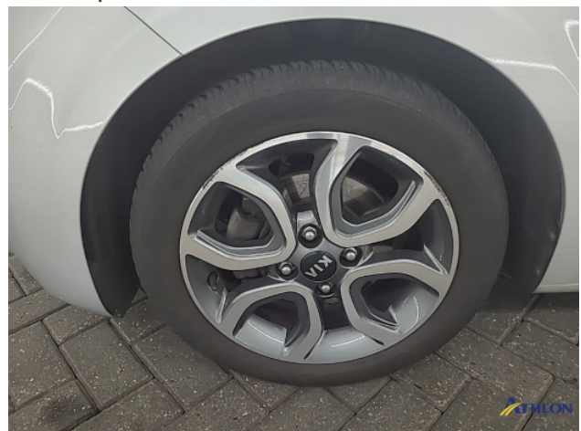
1. diverse schades Gebruikssporen