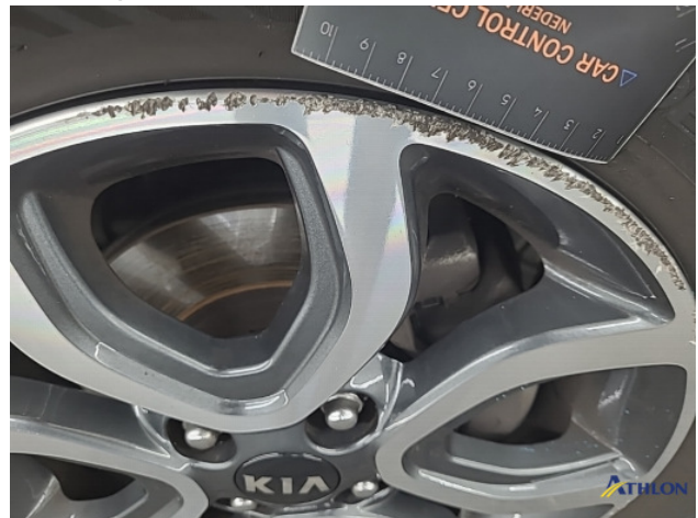
1. diverse schades Gebruikssporen