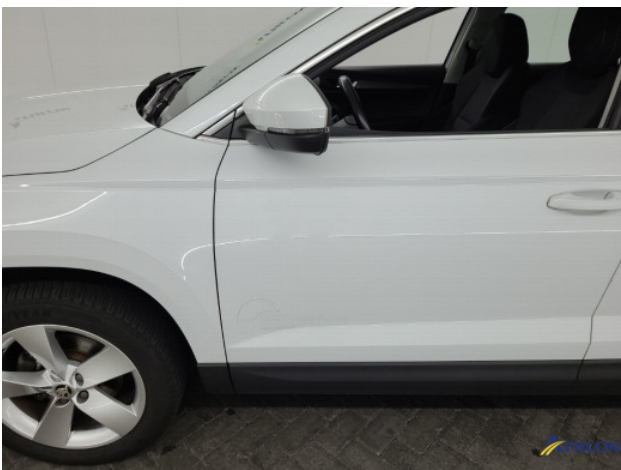
1. Ontstickeringsresten Gebruikssporen