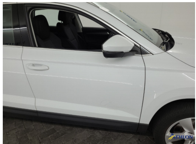
1. Ontstickeringsresten Gebruikssporen