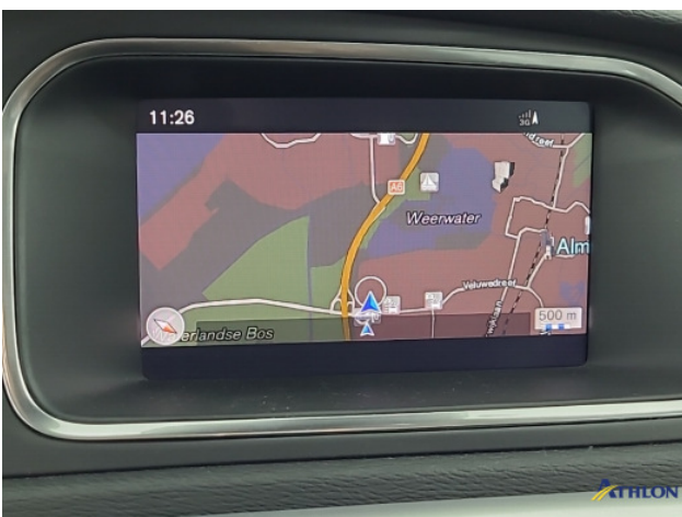
Navigatie of radio