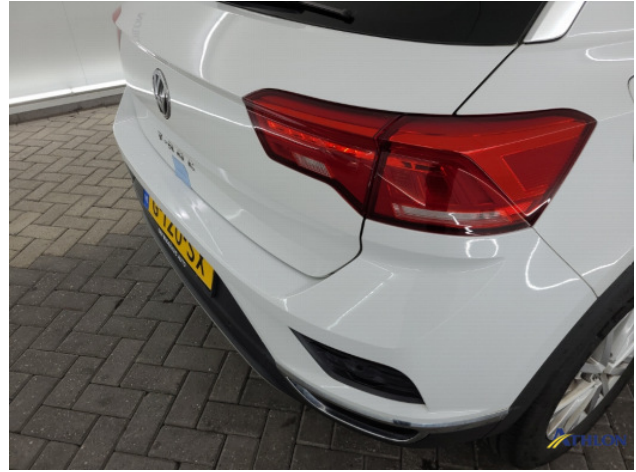
2. Oneffenheden lak Gebruikssporen