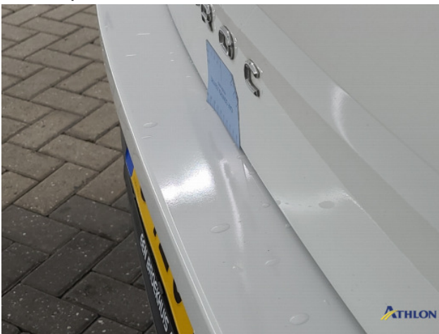
2. Oneffenheden lak Gebruikssporen