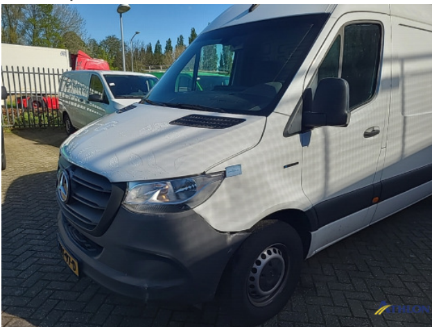
1. Bus al gecalculeerd Gebruikssporen