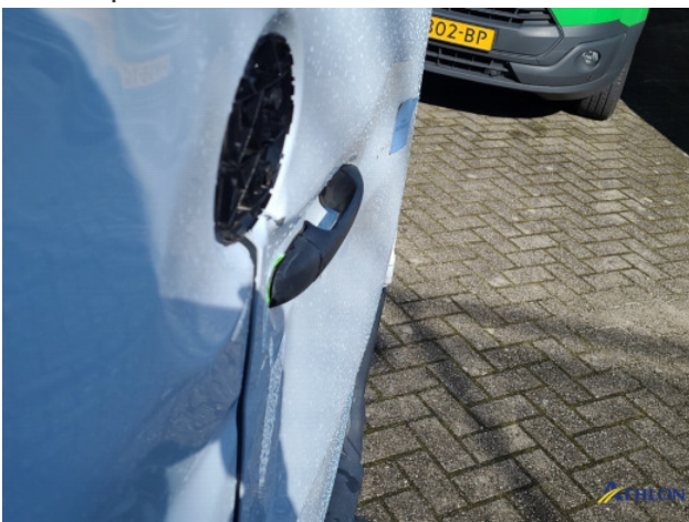
1. Bus al gecalculeerd Gebruikssporen