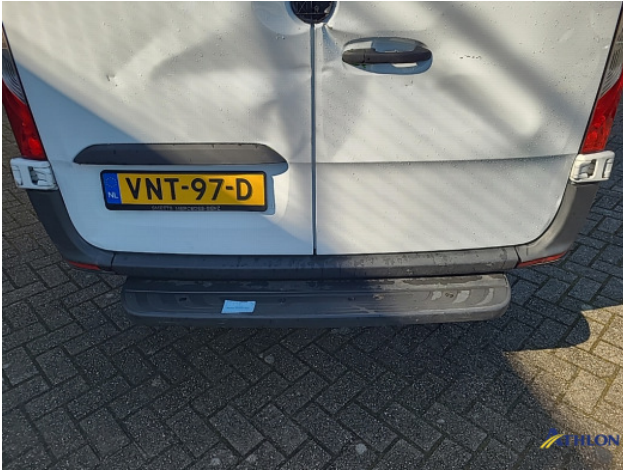
1. Bus al gecalculeerd Gebruikssporen