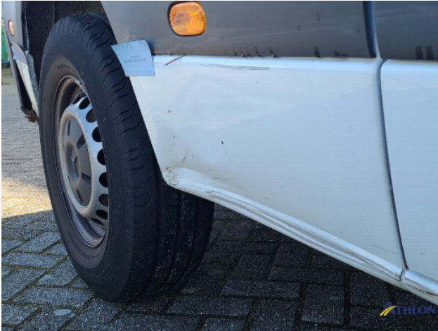
1. Bus al gecalculeerd Gebruikssporen