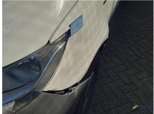
1. Bus al gecalculeerd Gebruikssporen