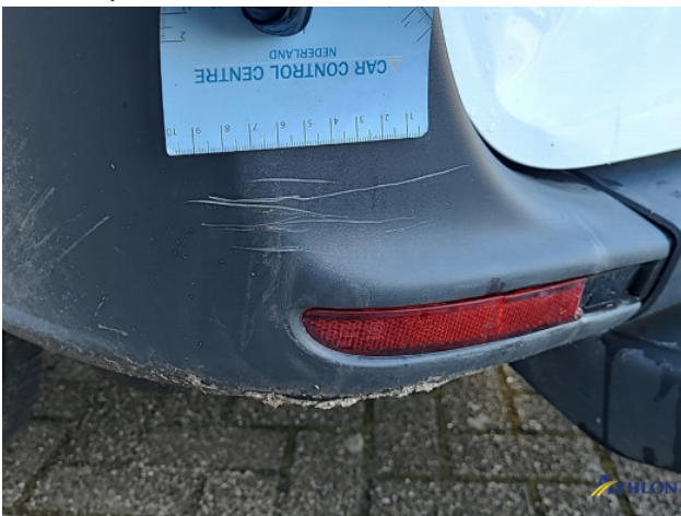
1. Bus al gecalculeerd Gebruikssporen