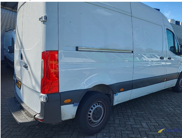
1. Bus al gecalculeerd Gebruikssporen