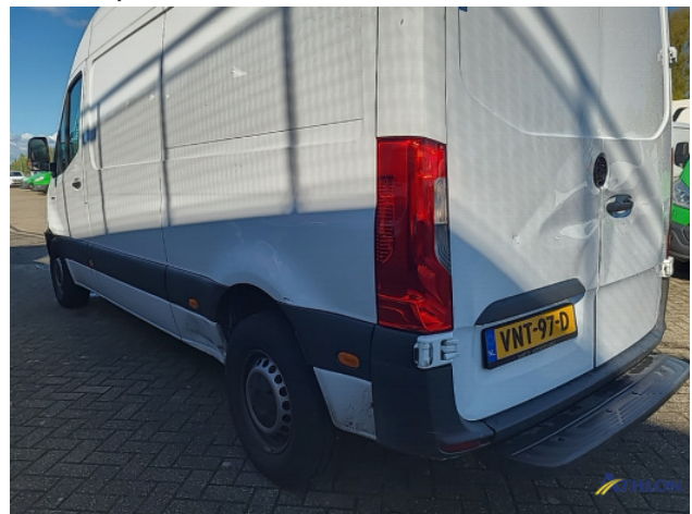
1. Bus al gecalculeerd Gebruikssporen