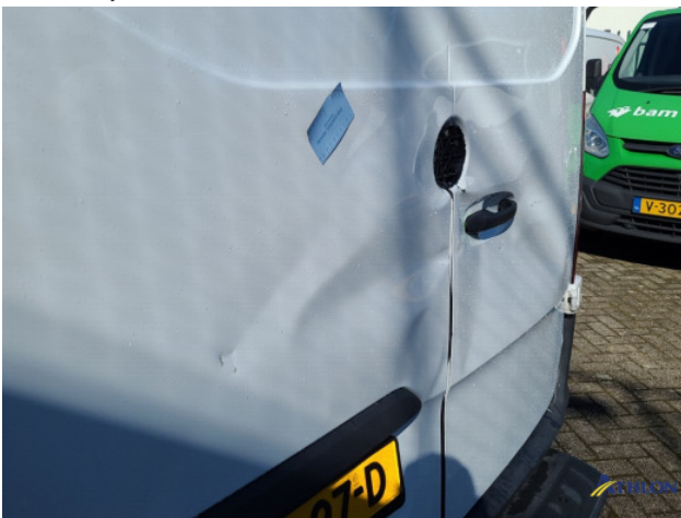
1. Bus al gecalculeerd Gebruikssporen