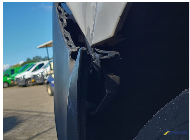
1. Bus al gecalculeerd Gebruikssporen