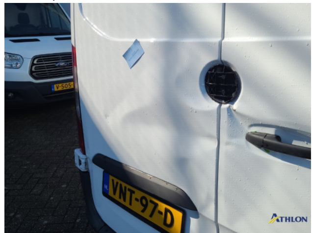
1. Bus al gecalculeerd Gebruikssporen