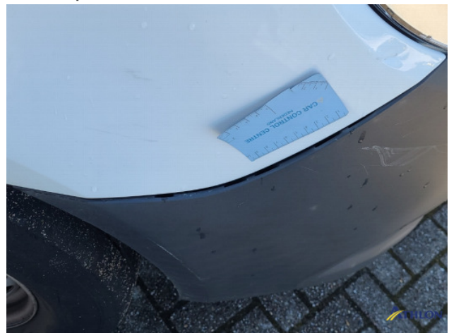
1. Bus al gecalculeerd Gebruikssporen