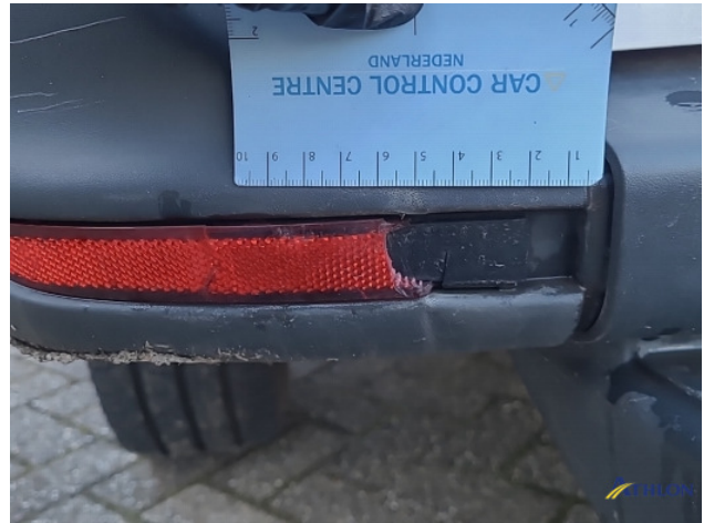
1. Bus al gecalculeerd Gebruikssporen