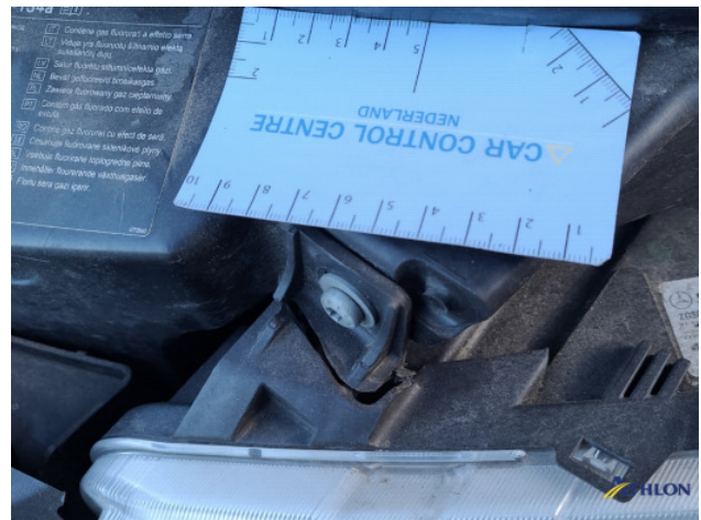
1. Bus al gecalculeerd Gebruikssporen