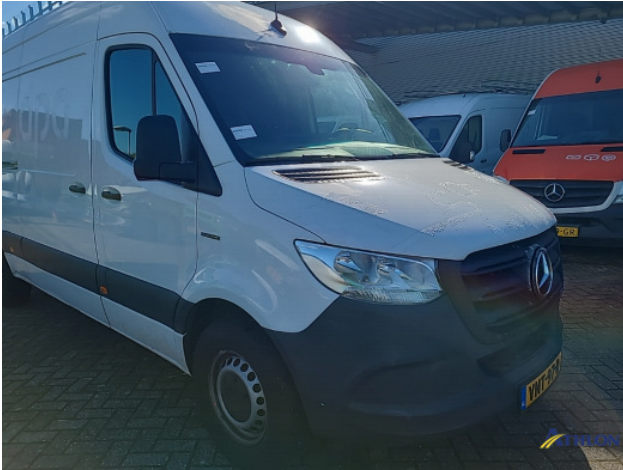
1. Bus al gecalculeerd Gebruikssporen