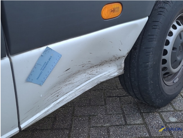
1. Bus al gecalculeerd Gebruikssporen