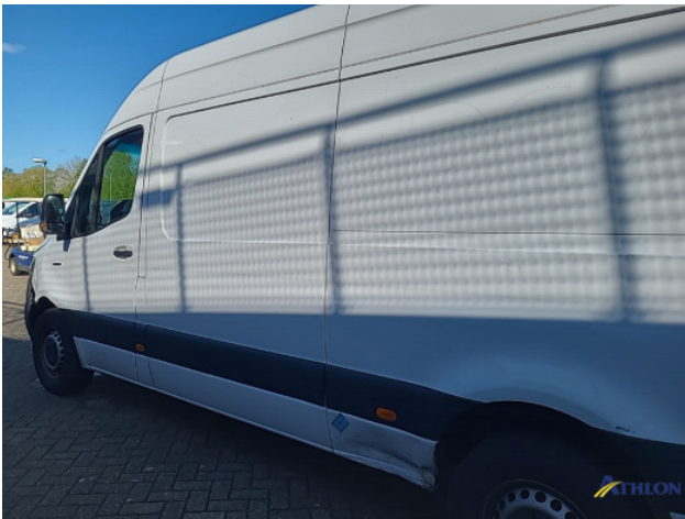
1. Bus al gecalculeerd Gebruikssporen