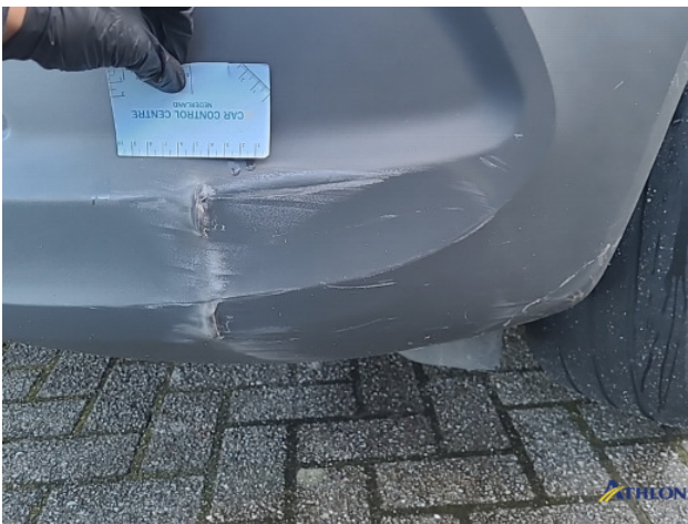
1. Bus al gecalculeerd Gebruikssporen