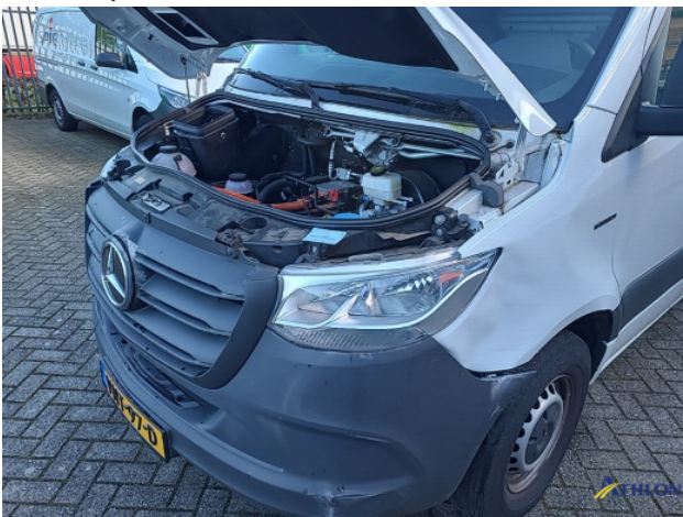
1. Bus al gecalculeerd Gebruikssporen