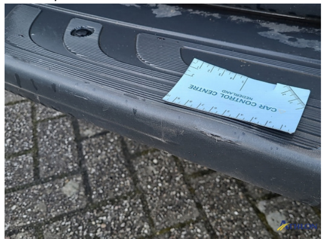
1. Bus al gecalculeerd Gebruikssporen