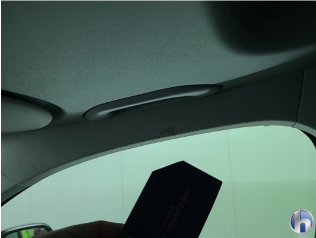
4. Interieur Gebruikssporen - Aanvaardbaar