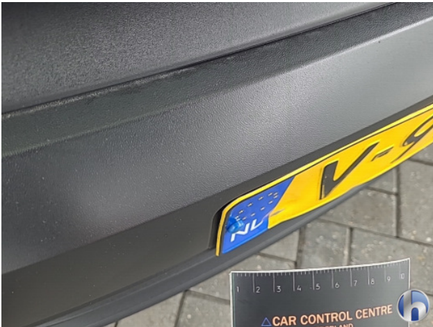
1. Kentekenplaat Gebruikssporen - Aanvaardbaar