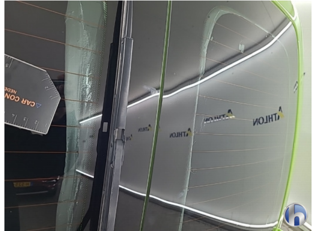
6. Diverse Gebruikssporen - Aanvaardbaar