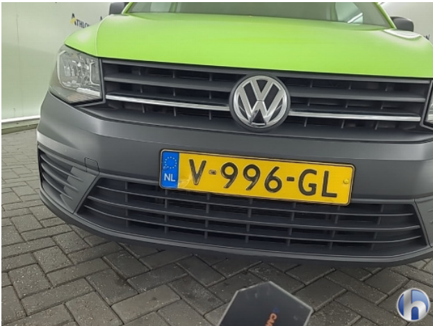
1. Voorbumper Krassen - Spot Repair/Deelreparatie