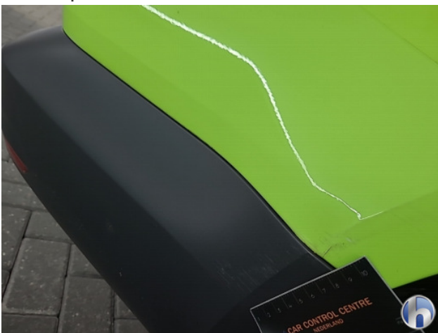
6. Diverse Gebruikssporen - Aanvaardbaar