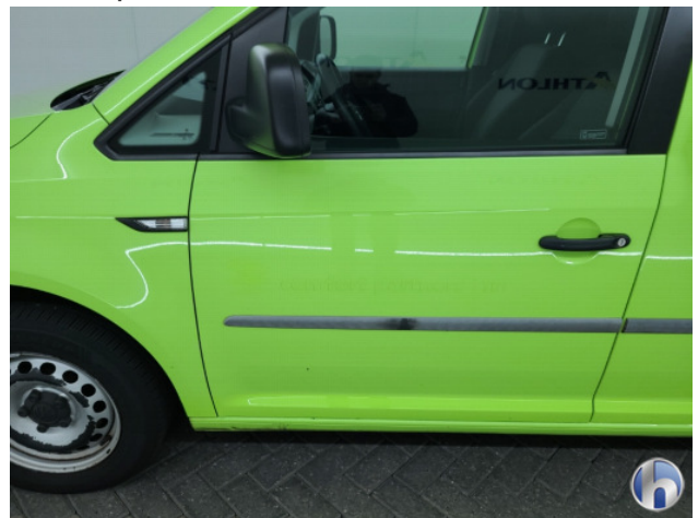
5. Ontstickerings resten Gebruikssporen - Aanvaardbaar