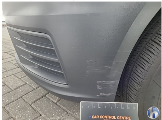
1. Voorbumper Krassen - Spot Repair/Deelreparatie