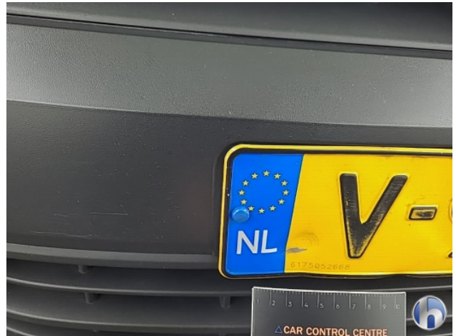
1. Kentekenplaat Gebruikssporen - Aanvaardbaar