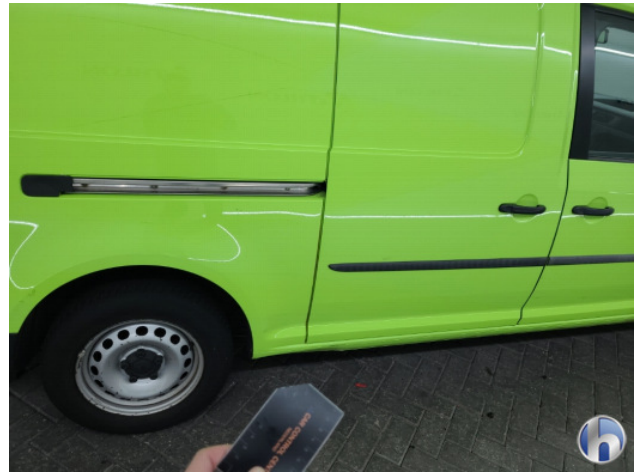
2. Dorpel - rechts Deuk/deuken - Herstellen