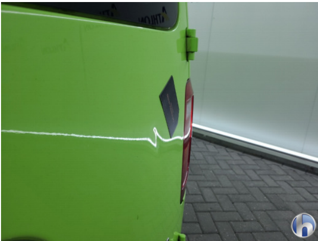
3. Achterklep Gebruikssporen - Aanvaardbaar