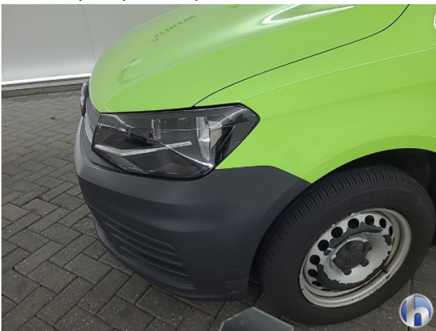
1. Voorbumper Krassen - Spot Repair/Deelreparatie