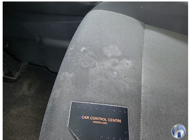
4. Interieur Gebruikssporen - Aanvaardbaar