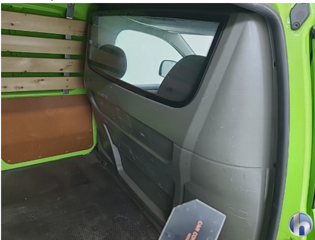
6. Diverse Gebruikssporen - Aanvaardbaar