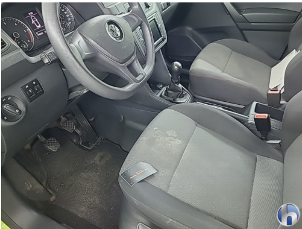
4. Interieur Gebruikssporen - Aanvaardbaar