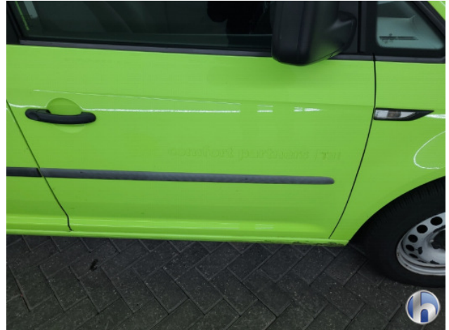
5. Ontstickerings resten Gebruikssporen - Aanvaardbaar