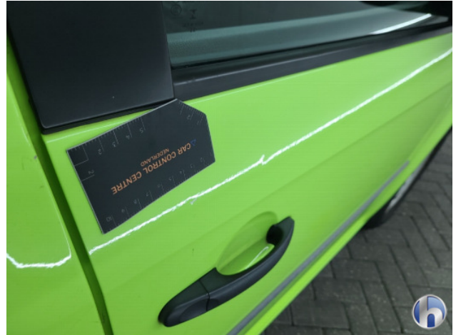
6. Diverse Gebruikssporen - Aanvaardbaar