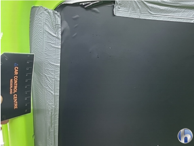
6. Diverse Gebruikssporen - Aanvaardbaar