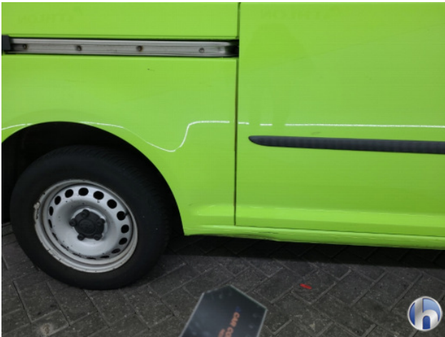
2. Dorpel - rechts Deuk/deuken - Herstellen