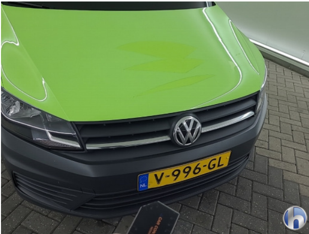
1. Kentekenplaat Gebruikssporen - Aanvaardbaar