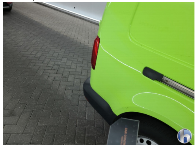
6. Diverse Gebruikssporen - Aanvaardbaar