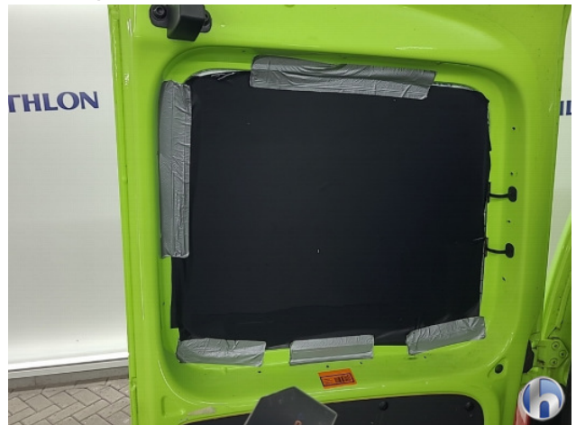
6. Diverse Gebruikssporen - Aanvaardbaar