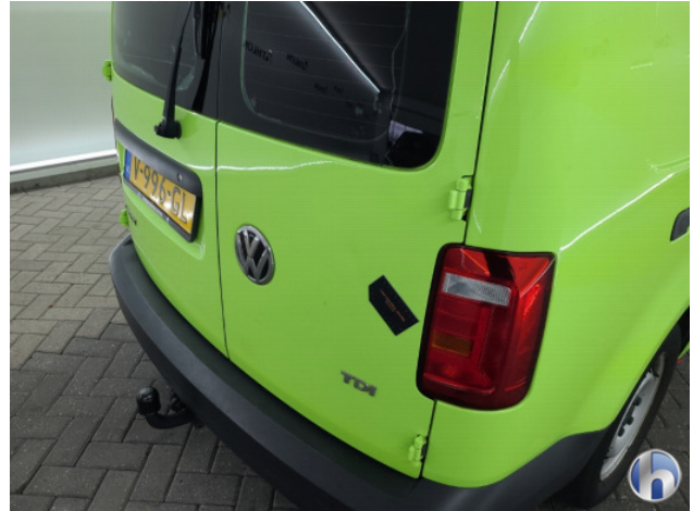
3. Achterklep Gebruikssporen - Aanvaardbaar