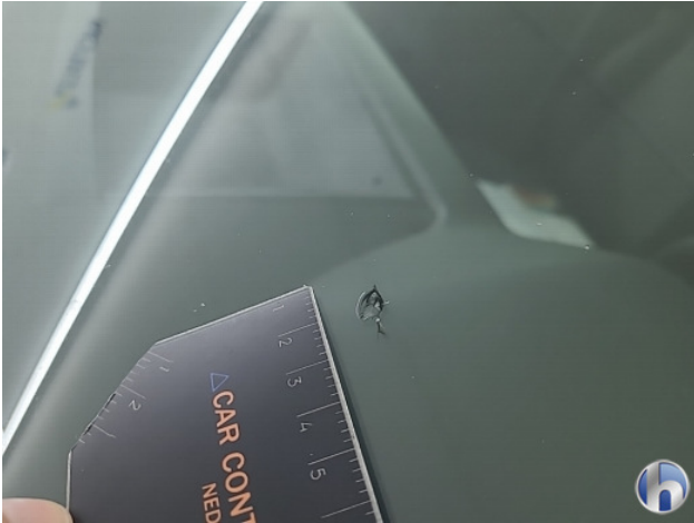
2. Voorruit Gebruikssporen - Aanvaardbaar