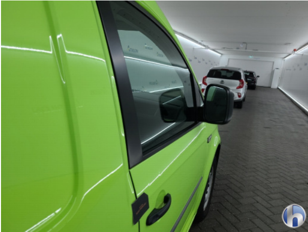
6. Diverse Gebruikssporen - Aanvaardbaar