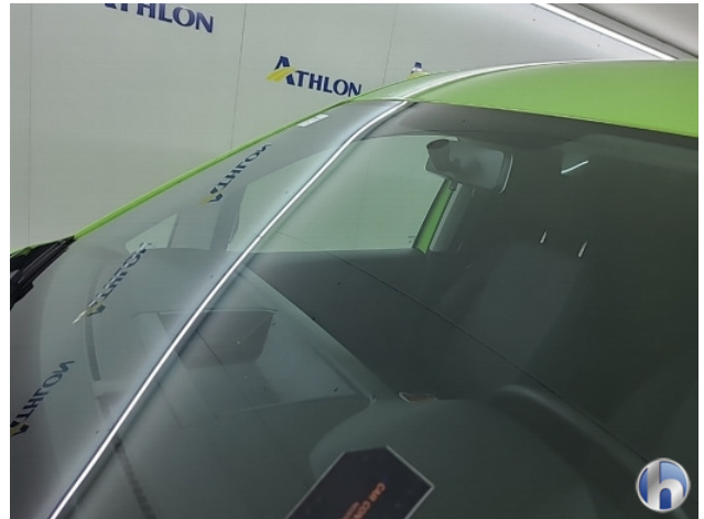
2. Voorruit Gebruikssporen - Aanvaardbaar