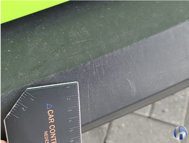
4. Interieur Gebruikssporen - Aanvaardbaar