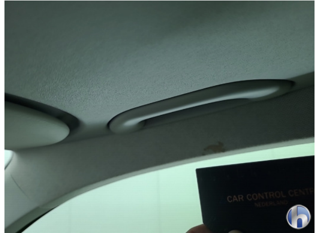
4. Interieur Gebruikssporen - Aanvaardbaar