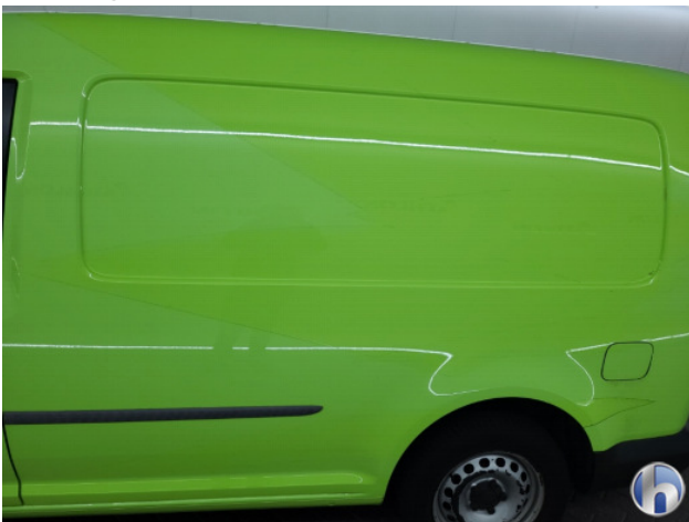
5. Ontstickerings resten Gebruikssporen - Aanvaardbaar