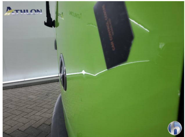
3. Achterklep Gebruikssporen - Aanvaardbaar