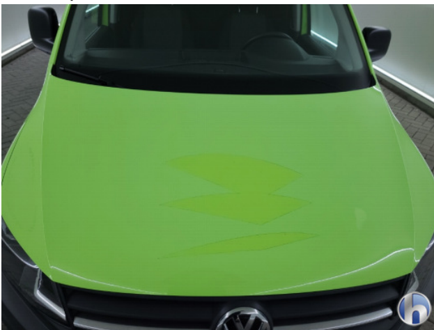
5. Ontstickerings resten Gebruikssporen - Aanvaardbaar