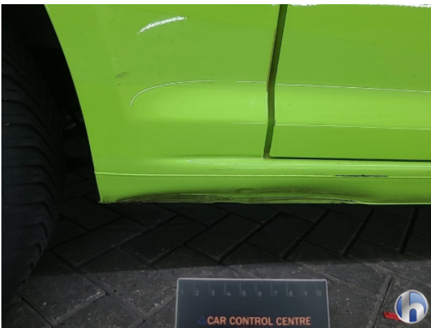
2. Dorpel - rechts Deuk/deuken - Herstellen