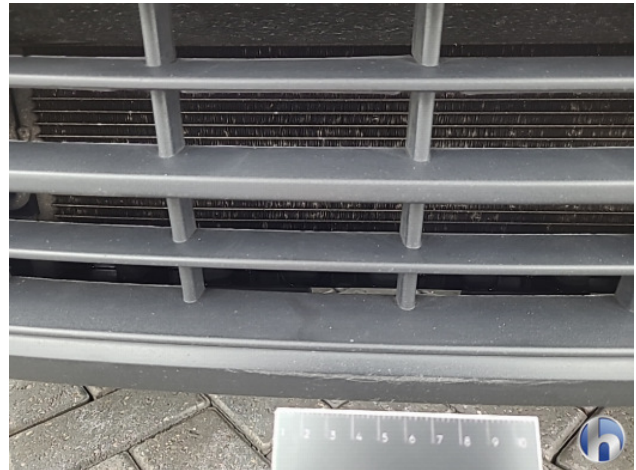
1. Voorbumper Krassen - Spot Repair/Deelreparatie