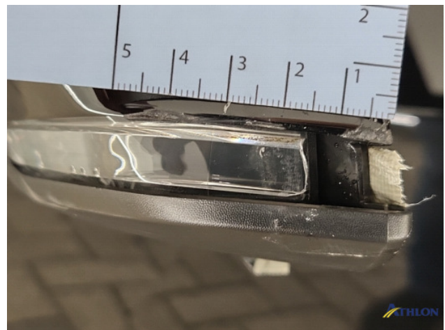
1. Spiegelbehuizing - links Barst