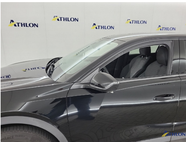
1. Spiegelbehuizing - links Barst