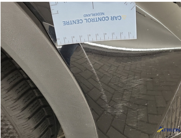
2. Voorbumper Schaafplek