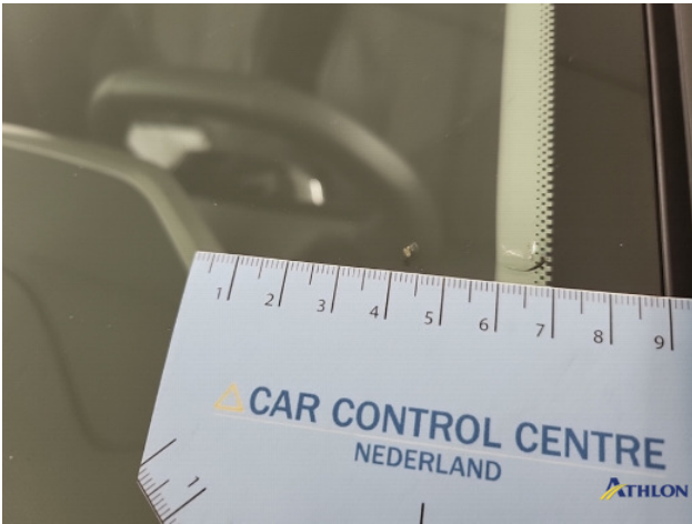
3. diverse Gebruikssporen