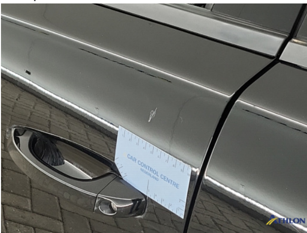
3. diverse Gebruikssporen