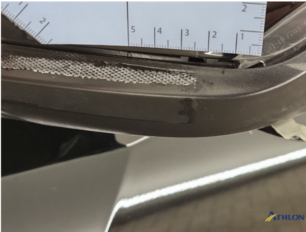
1. Spiegelbehuizing - links Barst