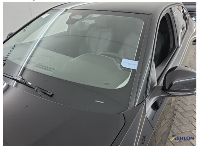
3. diverse Gebruikssporen