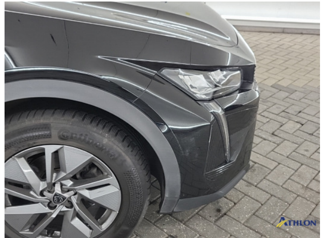
2. Voorbumper Schaafplek