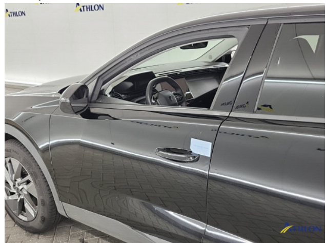
3. diverse Gebruikssporen