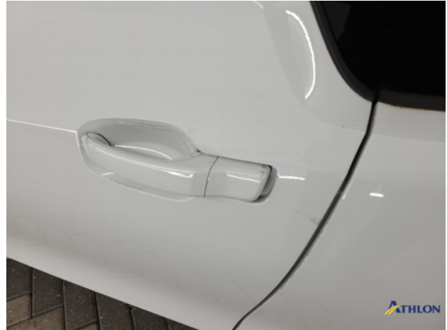
1. diverse Gebruikssporen