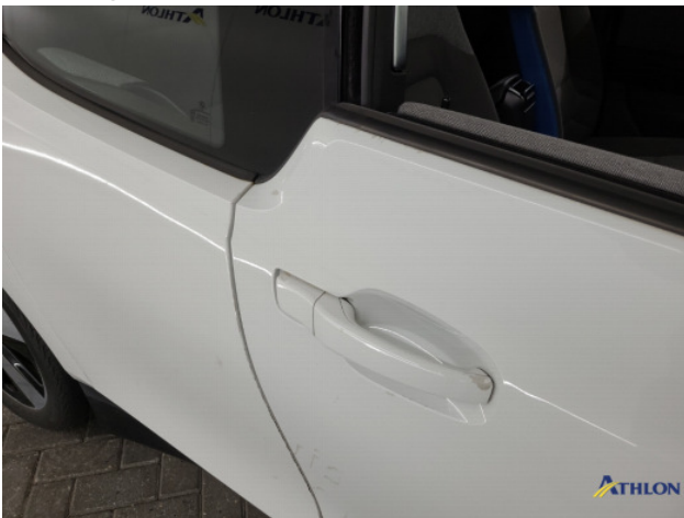
1. diverse Gebruikssporen