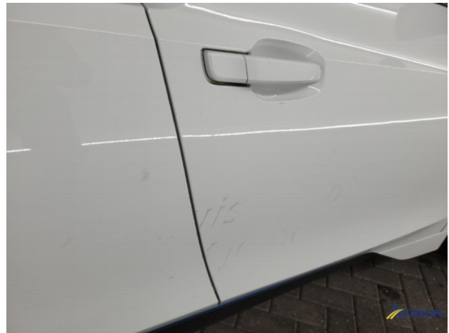
1. diverse Gebruikssporen