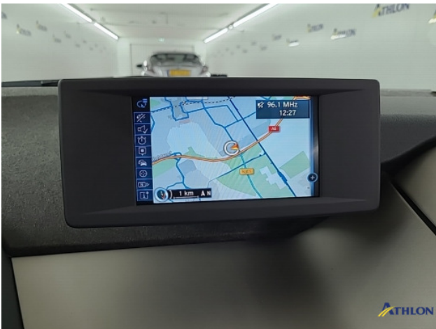
Navigatie of radio