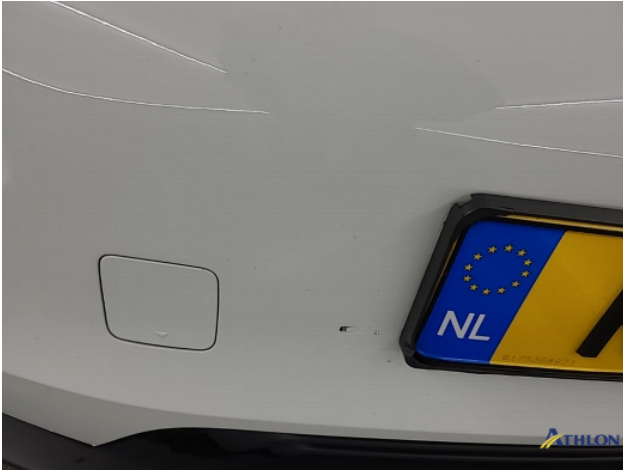
1. diverse Gebruikssporen