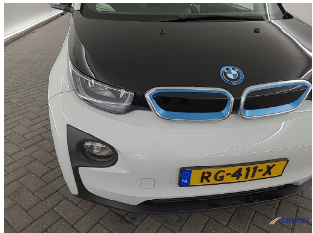
1. diverse Gebruikssporen