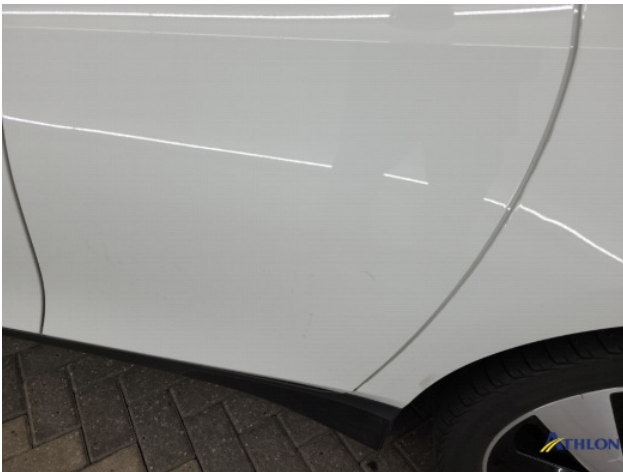
1. diverse Gebruikssporen