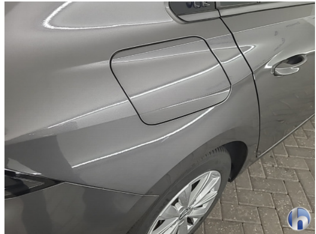
1. diverse Gebruikssporen - Aanvaardbaar