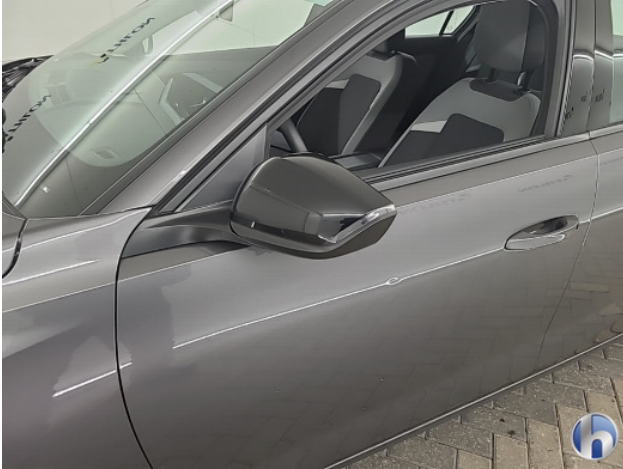
1. diverse Gebruikssporen - Aanvaardbaar