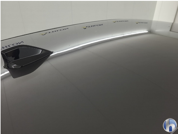
1. diverse Gebruikssporen - Aanvaardbaar