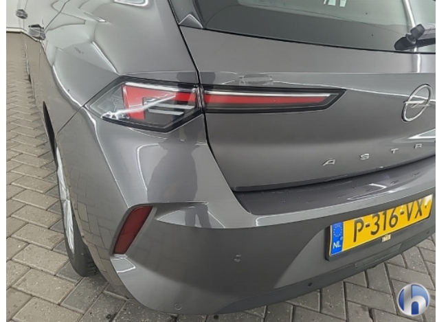
1. diverse Gebruikssporen - Aanvaardbaar