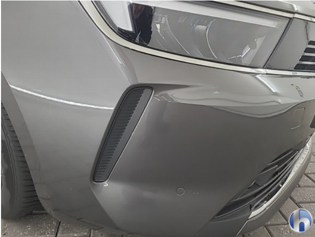
1. diverse Gebruikssporen - Aanvaardbaar