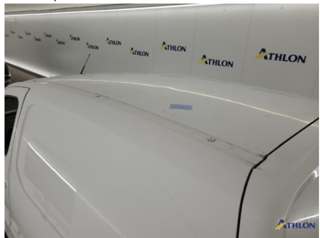
4. Diverse Gebruikssporen