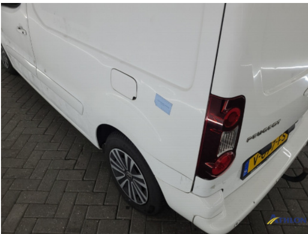
1. Zijwand - achter - Links Deuk/deuken