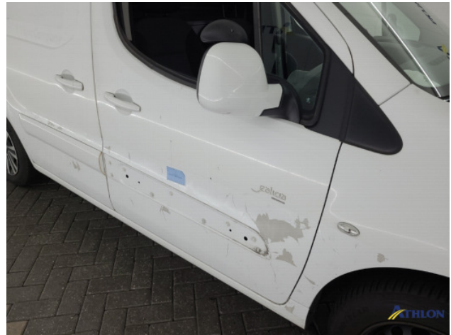
3. Stootlijst Ontbreekt