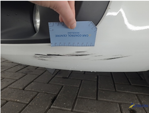
2. Voorbumper Schaafplek