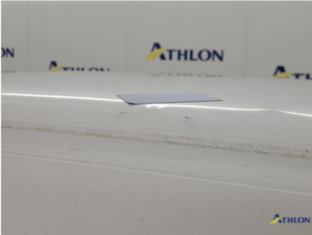
4. Diverse Gebruikssporen