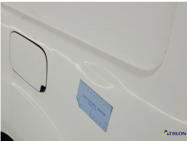
1. Zijwand - achter - Links Deuk/deuken