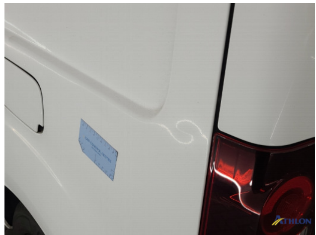
1. Zijwand - achter - Links Deuk/deuken