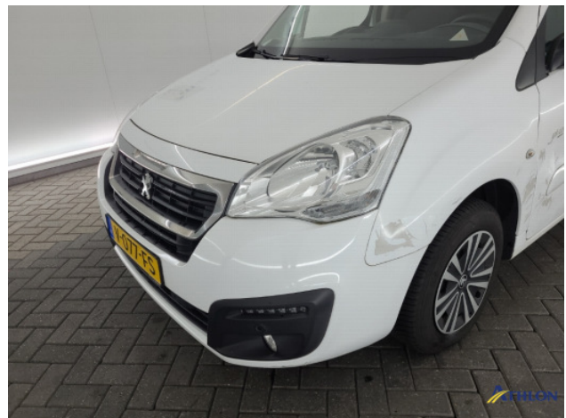
2. Voorbumper Schaafplek