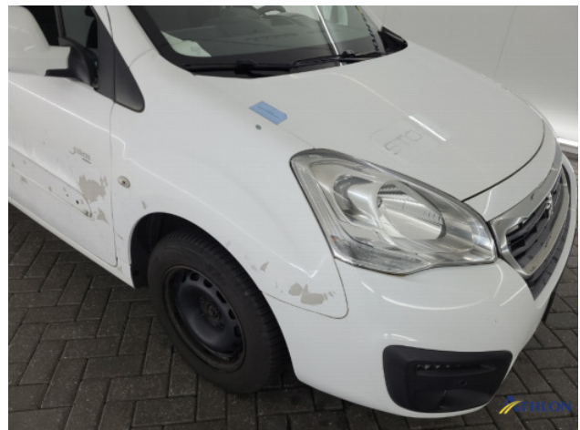
4. Diverse Gebruikssporen