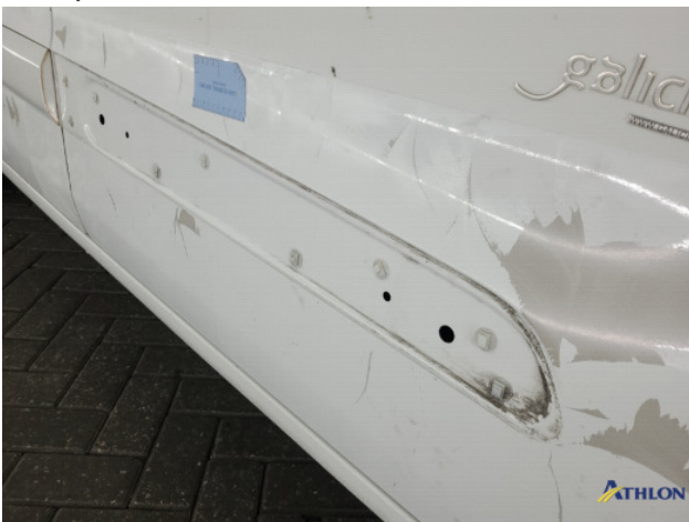
3. Stootlijst Ontbreekt