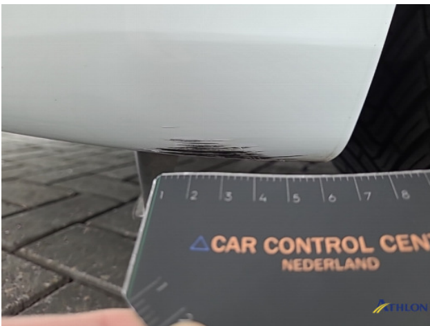
1. Voorbumper Krassen