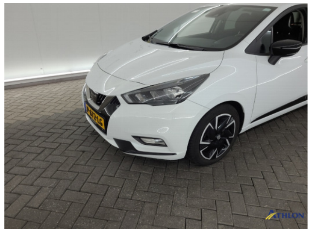
1. Voorbumper Krassen