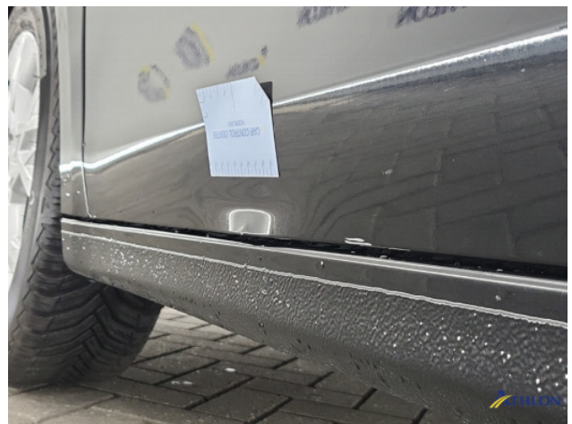
1. Portier voor - links Gedeukt