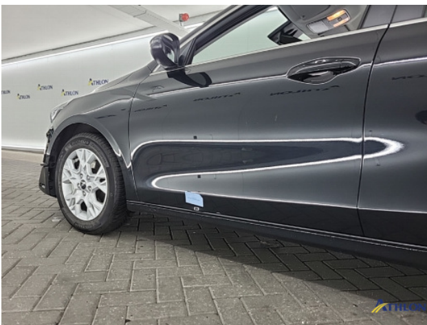
1. Portier voor - links Gedeukt