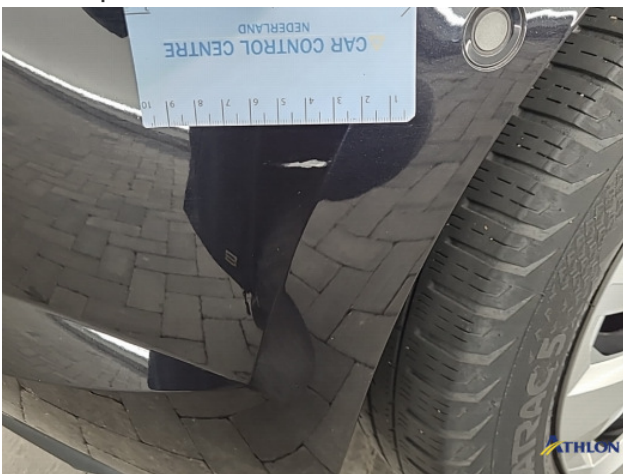
1. diverse Gebruikssporen