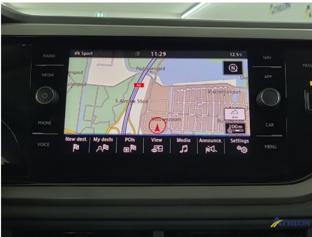
Navigatie of radio