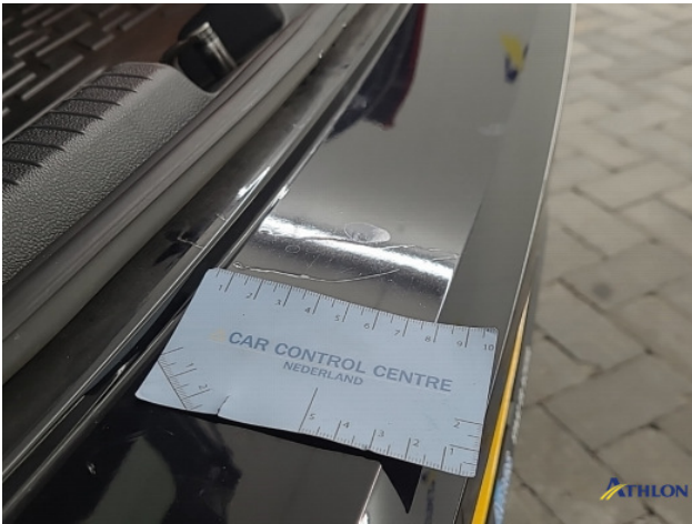
1. diverse Gebruikssporen