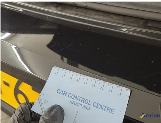
1. diverse Gebruikssporen