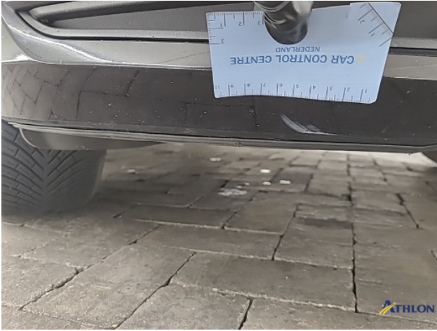
1. diverse Gebruikssporen