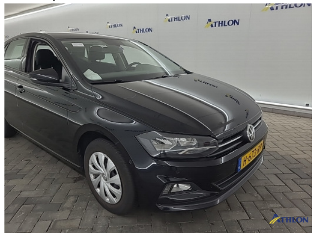
1. diverse Gebruikssporen