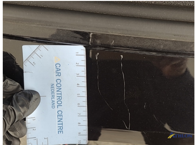
1. diverse Gebruikssporen