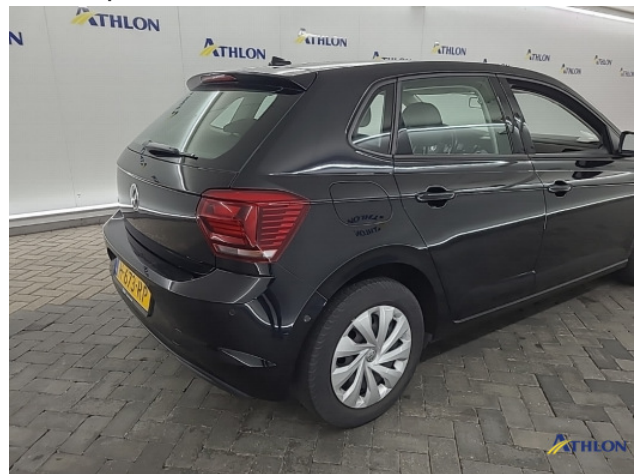
1. diverse Gebruikssporen