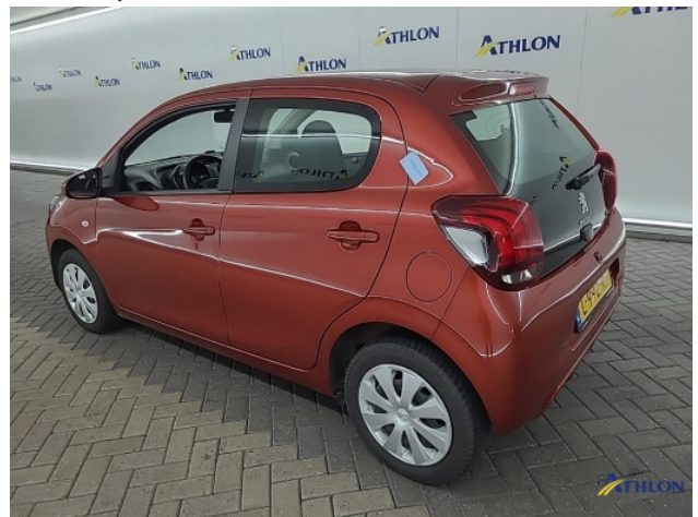
1. diverse Gebruikssporen