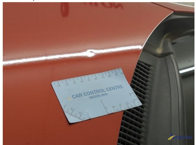
1. diverse Gebruikssporen