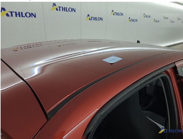
1. diverse Gebruikssporen