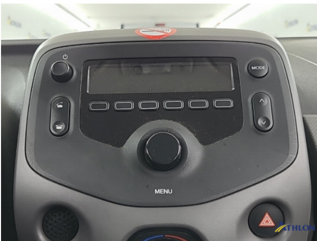
Navigatie of radio