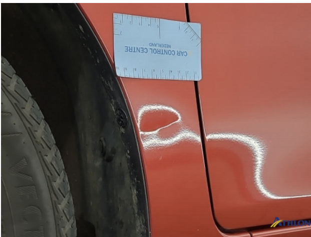
1. diverse Gebruikssporen