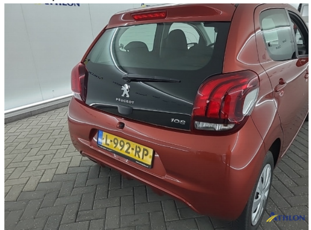
1. diverse Gebruikssporen