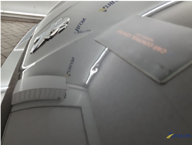
1. diverse shades Gebruikssporen