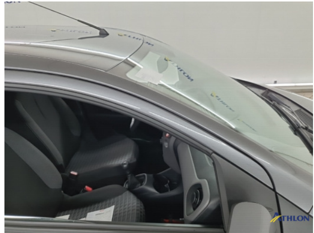
1. diverse shades Gebruikssporen