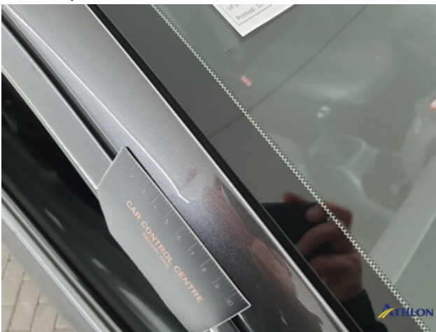
1. diverse shades Gebruikssporen