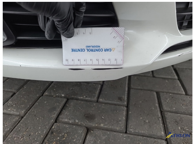
2. Voorbumper Krassen