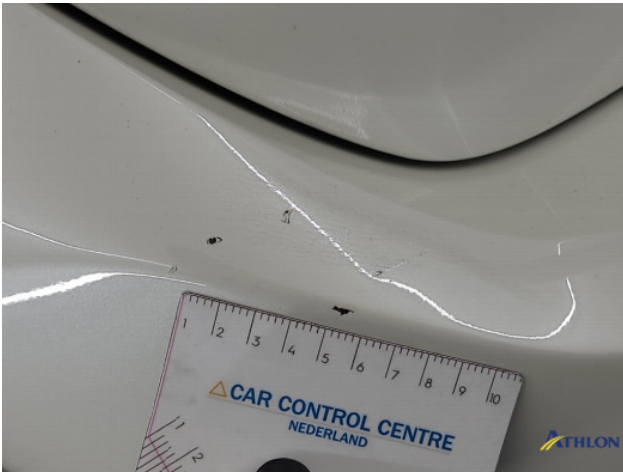
1. Achterbumper Deuk/deuken