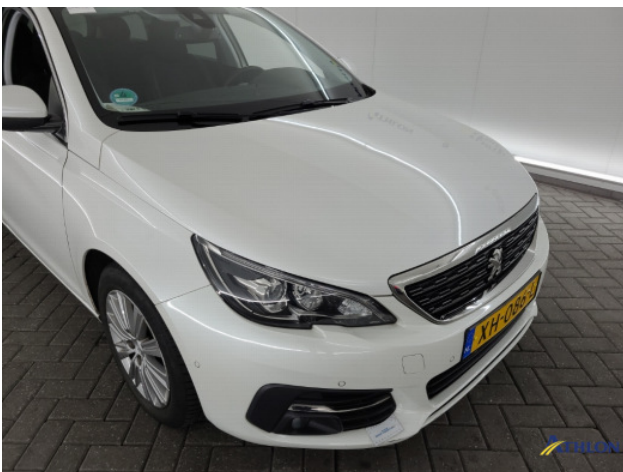
2. Voorbumper Krassen