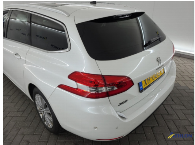
1. Achterbumper Deuk/deuken