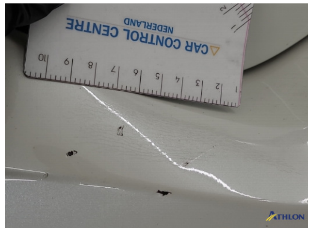
1. Achterbumper Deuk/deuken