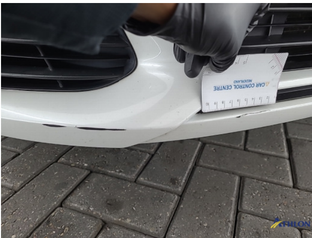
2. Voorbumper Krassen