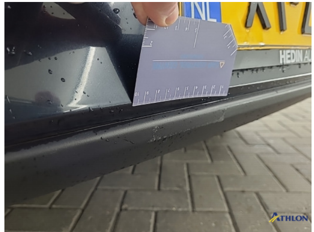
2. Achterbumper Breuk / barst / scheur