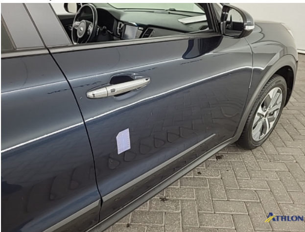
4. Diverse Gebruikssporen