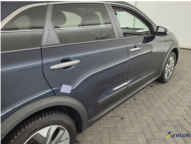
1. Portier achter - rechts Schaafplek