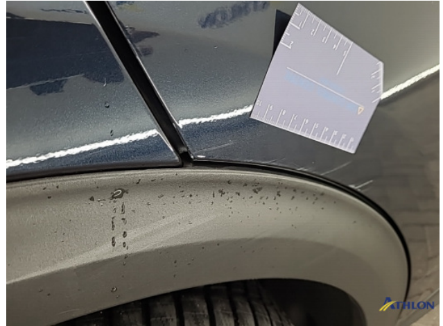
1. Portier achter - rechts Schaafplek