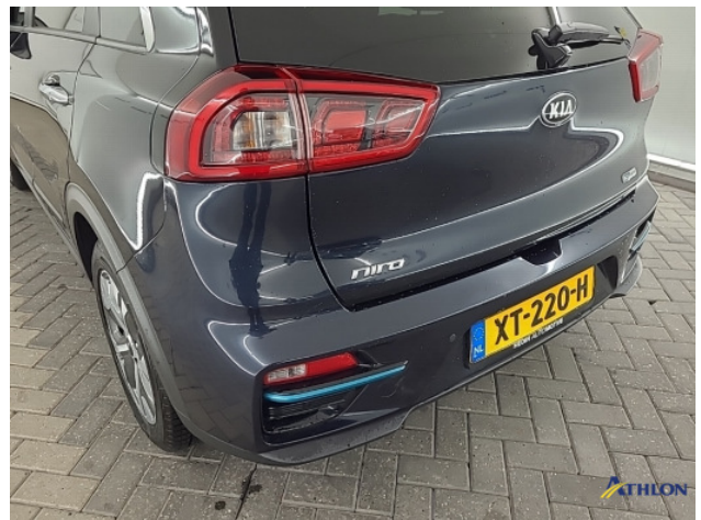
2. Achterbumper Breuk / barst / scheur