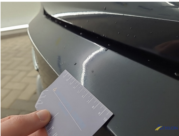
2. Achterbumper Breuk / barst / scheur