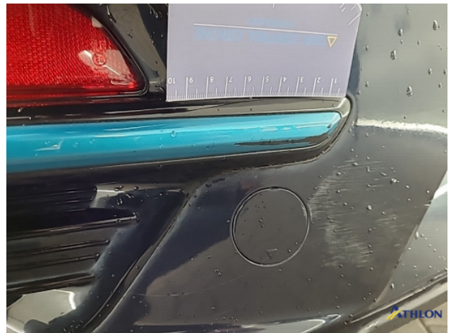
2. Achterbumper Breuk / barst / scheur