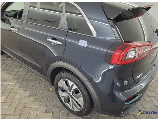
3. Zijwand - achter - Links Krassen