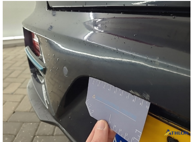
2. Achterbumper Breuk / barst / scheur