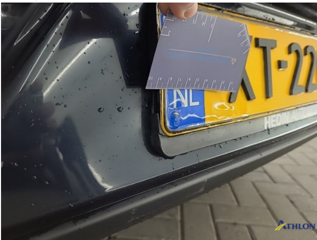
2. Achterbumper Breuk / barst / scheur