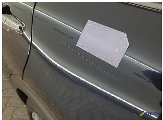
3. Zijwand - achter - Links Krassen