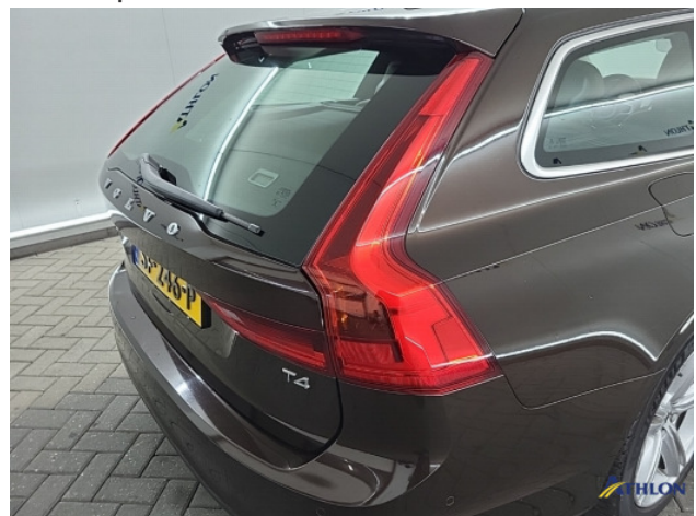
4. Achterlicht rechts Breuk / barst / scheur