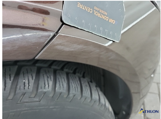
1. Voorscherm - rechts Schaafplek