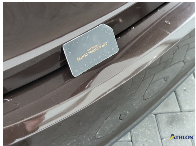
2. Achterbumper Deuk/deuken