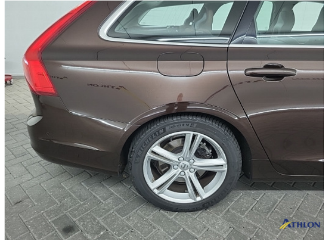
3. Diverse Gebruikssporen