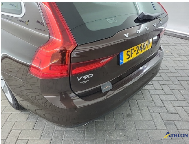
2. Achterbumper Deuk/deuken