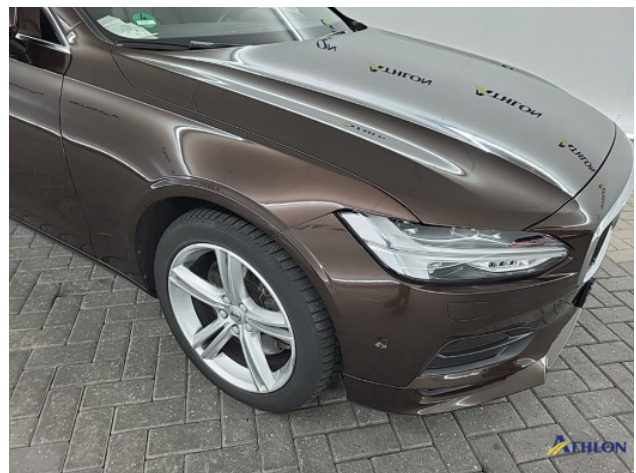
1. Voorscherm - rechts Schaafplek