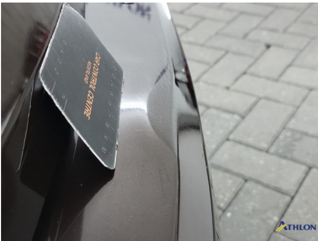
2. Achterbumper Deuk/deuken