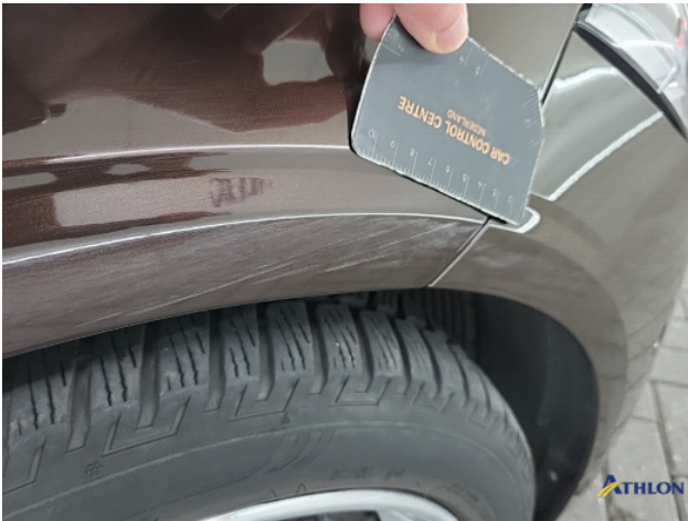
1. Voorscherm - rechts Schaafplek