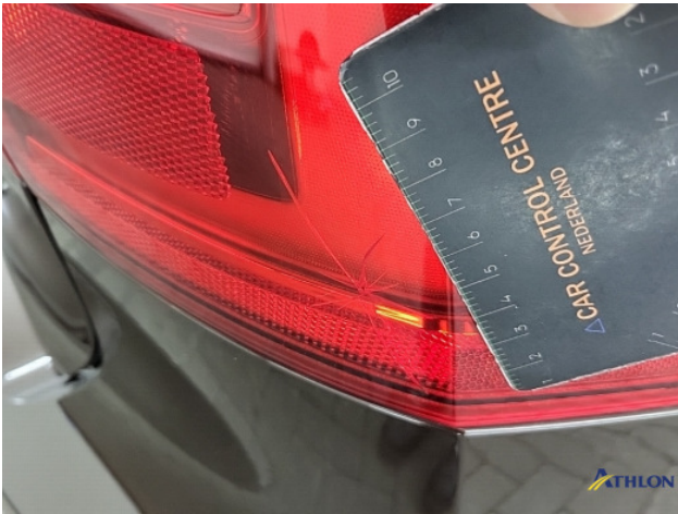
4. Achterlicht rechts Breuk / barst / scheur