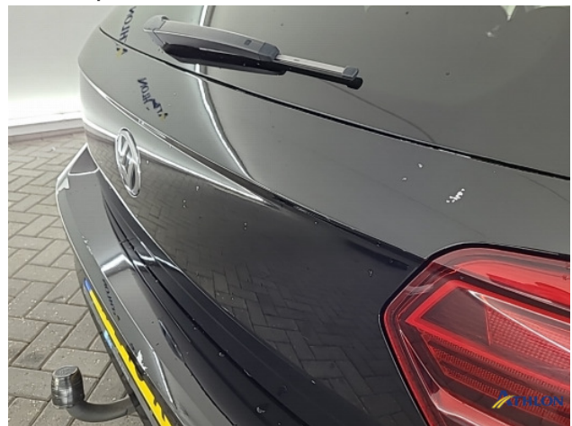
1. Ontstickerresten Gebruikssporen