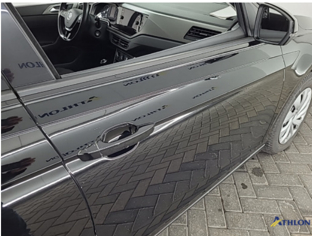
1. Ontstickerresten Gebruikssporen