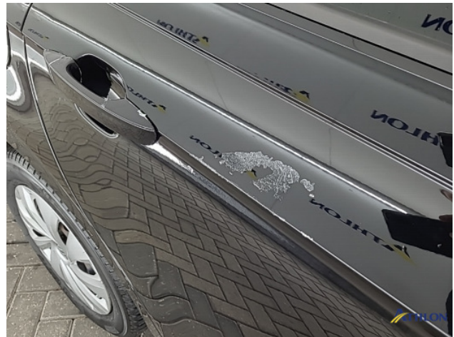
1. Ontstickerresten Gebruikssporen