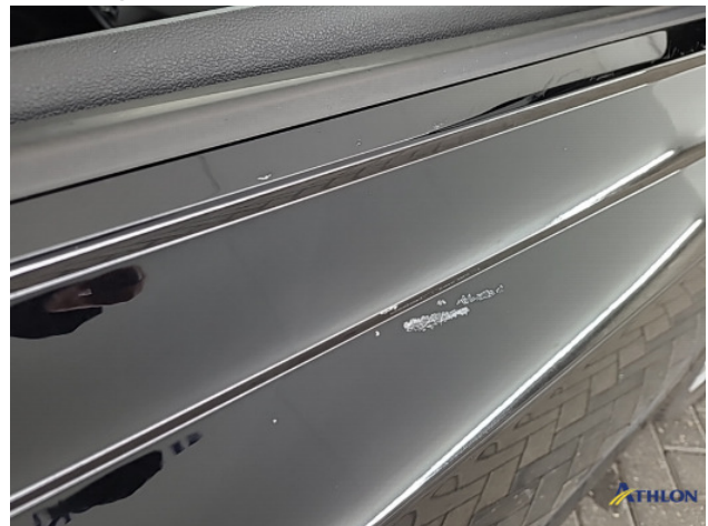
1. Ontstickerresten Gebruikssporen