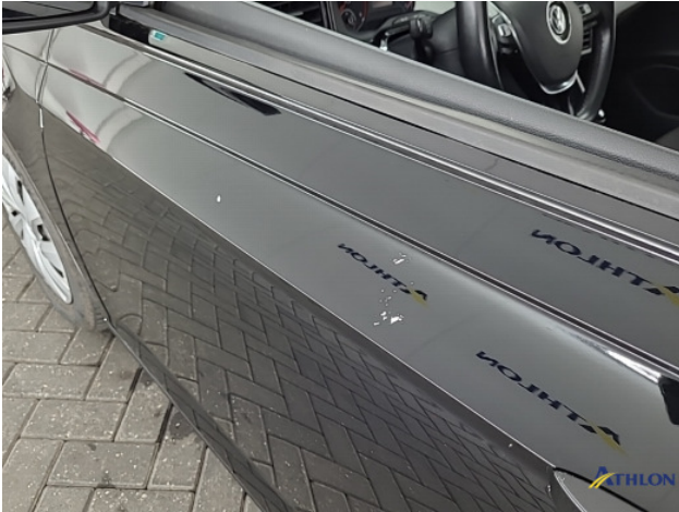
1. Ontstickerresten Gebruikssporen