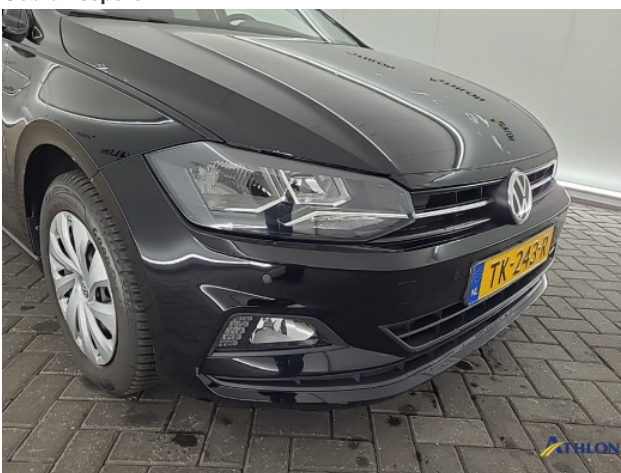
1. Ontstickeresten Gebruikssporen