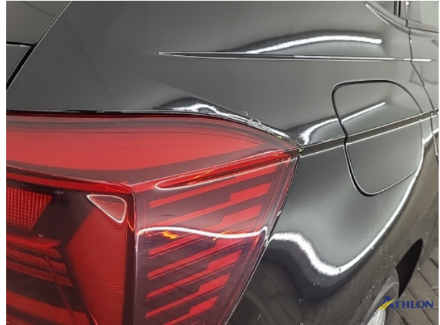
1. Ontstickerresten Gebruikssporen