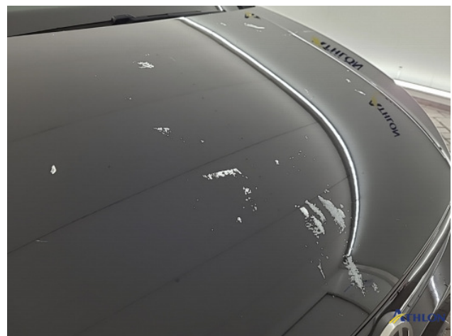
1. Ontstickeresten Gebruikssporen