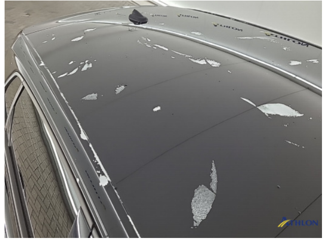
1. Ontstickerresten Gebruikssporen