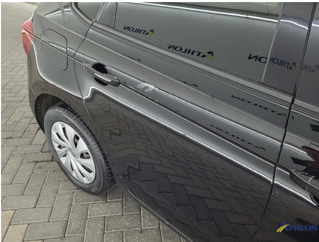
1. Ontstickerresten Gebruikssporen