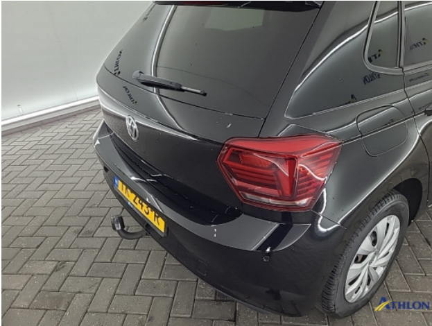
1. Ontstickerresten Gebruikssporen