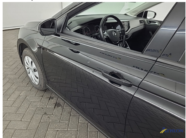
1. Ontstickerresten Gebruikssporen