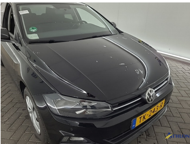
1. Ontstickeresten Gebruikssporen