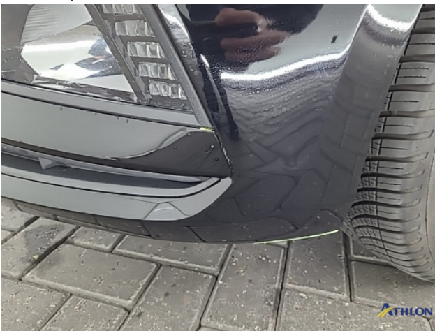
1. Ontstickerresten Gebruikssporen