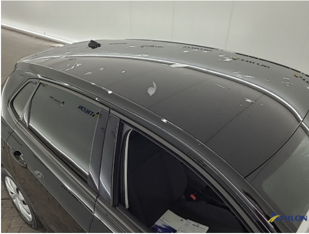
1. Ontstickerresten Gebruikssporen