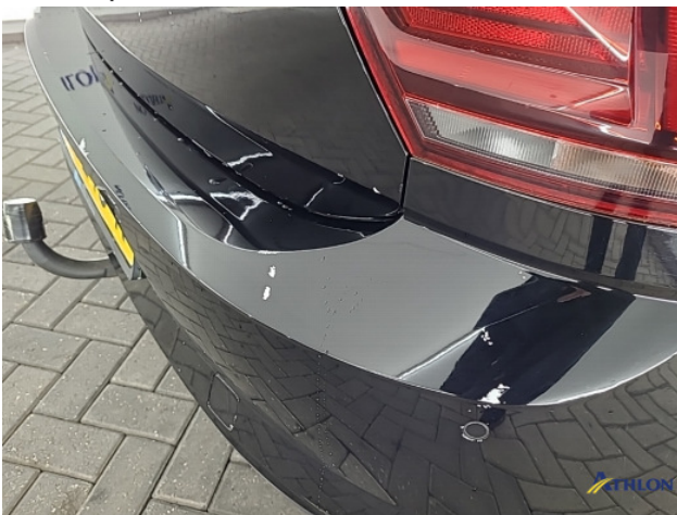
1. Ontstickerresten Gebruikssporen