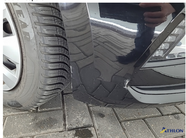
1. Ontstickeresten Gebruikssporen