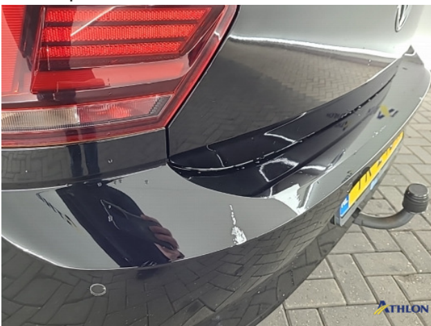
1. Ontstickerresten Gebruikssporen