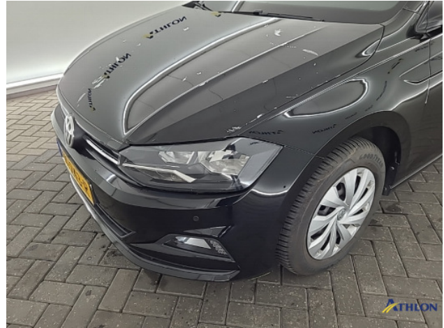
1. Ontstickerresten Gebruikssporen