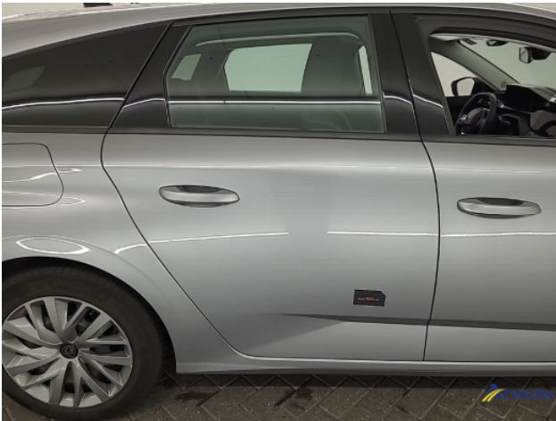
1. diverse schades Gebruikssporen