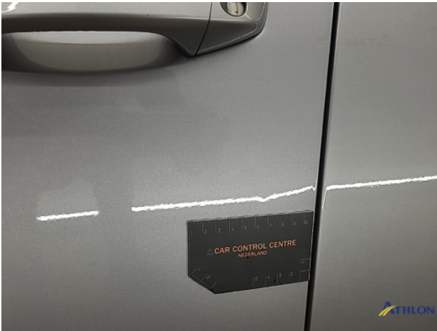
1. diverse schades Gebruikssporen