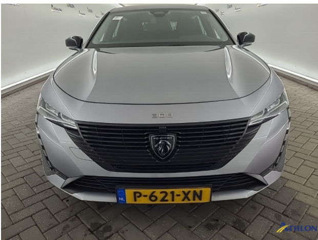
1. diverse schades Gebruikssporen