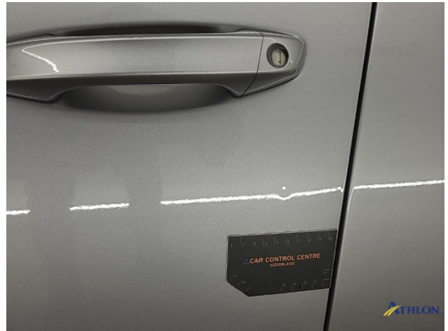
1. diverse schades Gebruikssporen