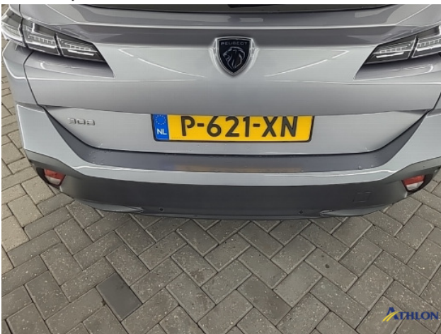
1. diverse schades Gebruikssporen