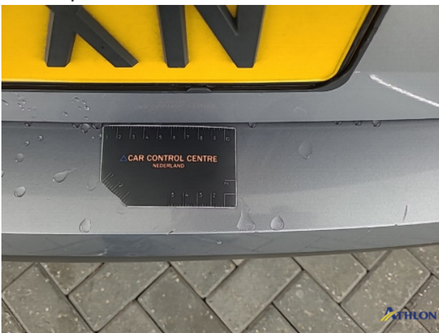
1. diverse schades Gebruikssporen