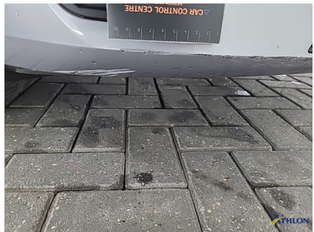
1. diverse schades Gebruikssporen