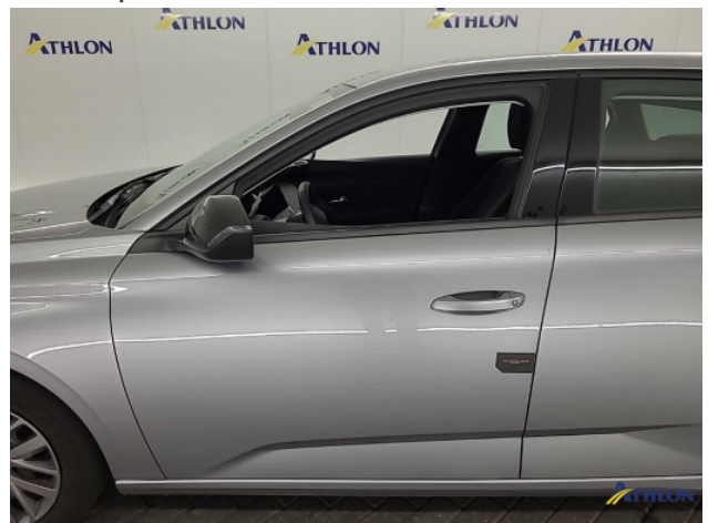
1. diverse schades Gebruikssporen