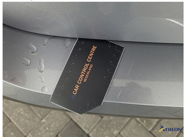
1. diverse schades Gebruikssporen