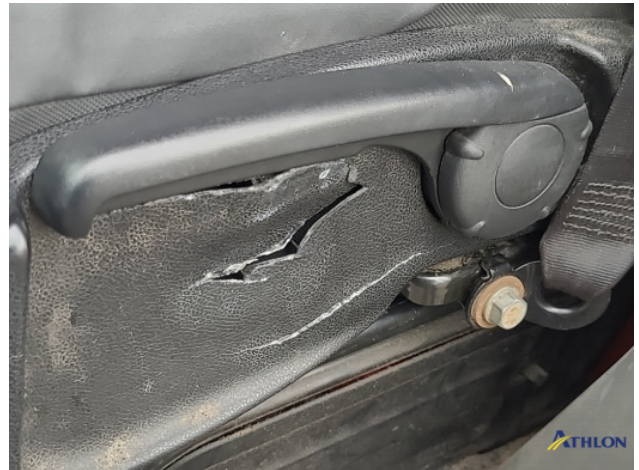
3. Diverse Interieurdelen Beschadigd