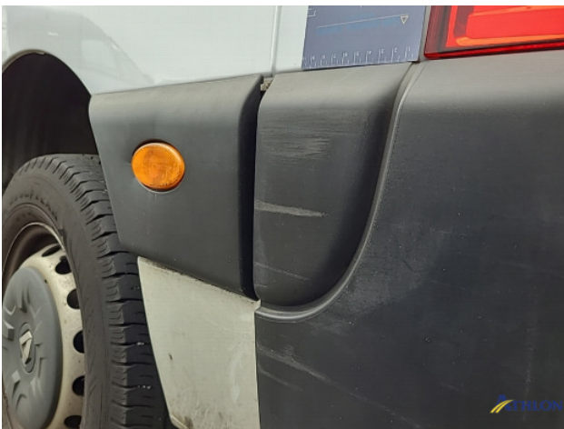
1. Achterbumper Schaafplek