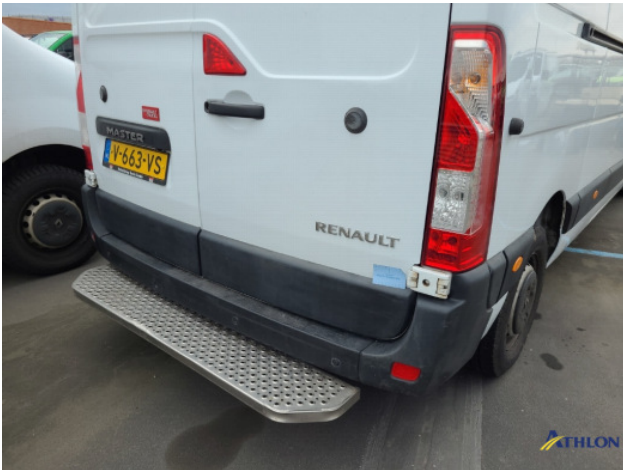
2. Sierlijsten achter - rechts Schaafplek