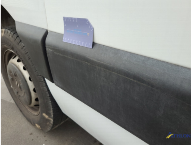
2. Sierlijsten achter - rechts Schaafplek