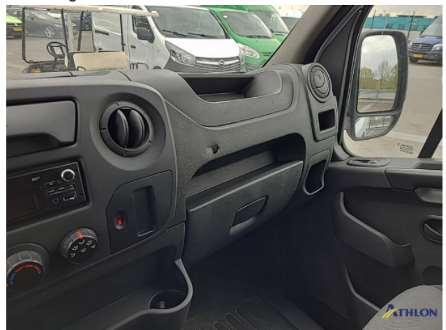
3. Diverse Interieurdelen Beschadigd