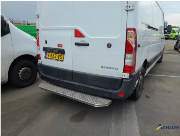
4. Diverse Gebruikssporen