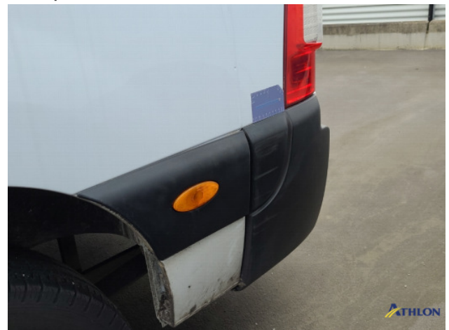
1. Achterbumper Schaafplek