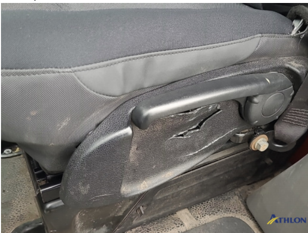
3. Diverse Interieurdelen Beschadigd