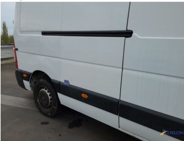
2. Sierlijsten achter - rechts Schaafplek