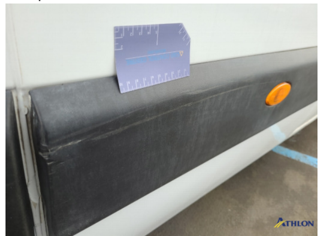
2. Sierlijsten achter - rechts Schaafplek