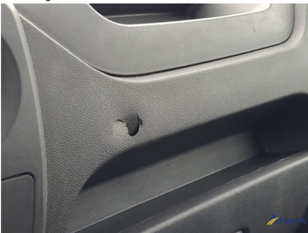
3. Diverse Interieurdelen Beschadigd