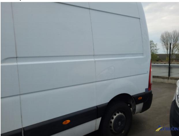
1. Achterbumper Schaafplek