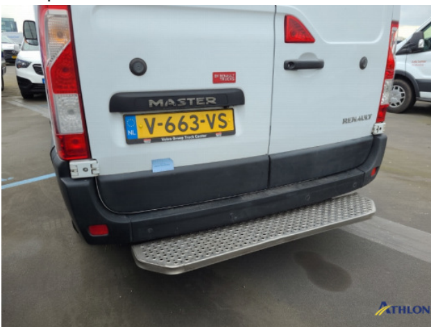
2. Sierlijsten achter - rechts Schaafplek