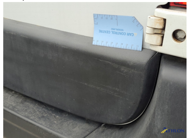
2. Sierlijsten achter - rechts Schaafplek