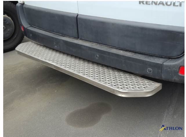
4. Diverse Gebruikssporen