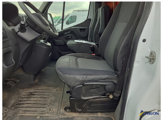
3. Diverse Interieurdelen Beschadigd