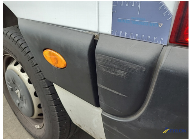
1. Achterbumper Schaafplek