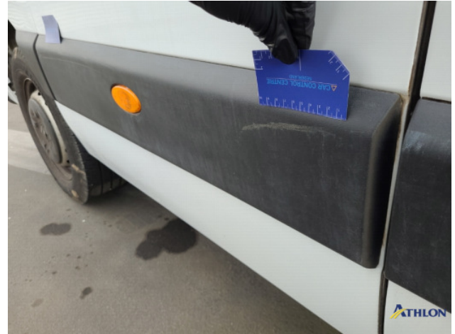
2. Sierlijsten achter - rechts Schaafplek