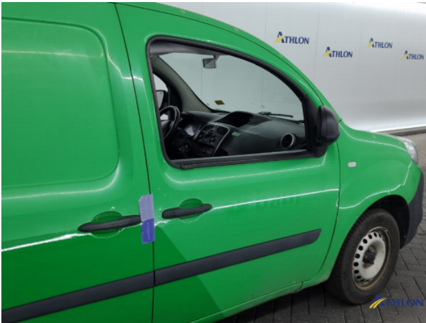
5. Portier voor - rechts Deuk/deuken