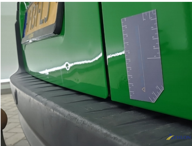
3. Achterklep Deuk/deuken