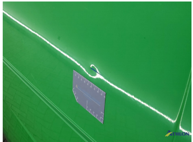
6. diverse Gebruikssporen