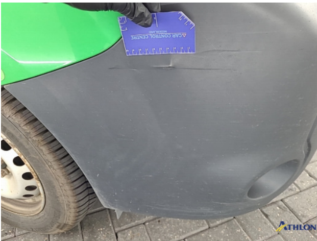
2. Voorbumper Schaafplek