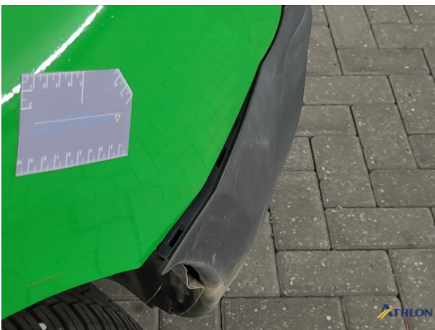
4. Zijwand - achter - Links Deuk/deuken