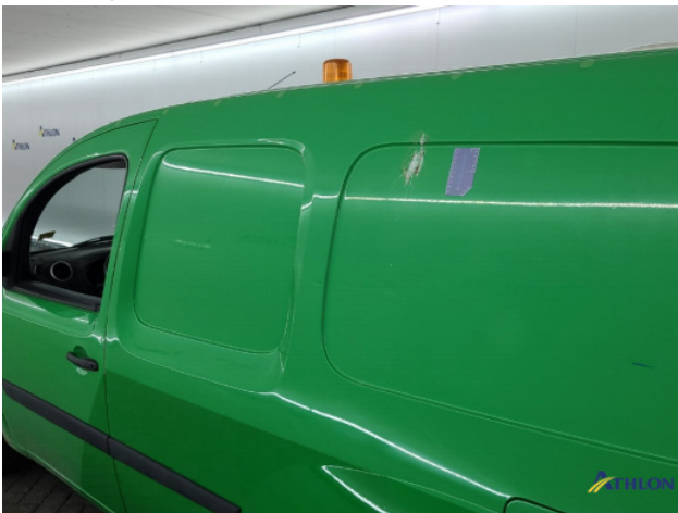
6. diverse Gebruikssporen