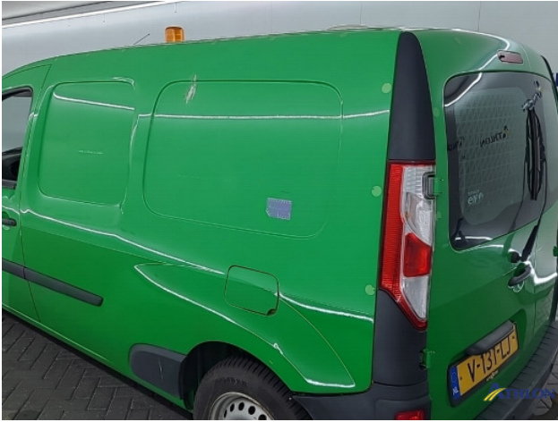
6. diverse Gebruikssporen