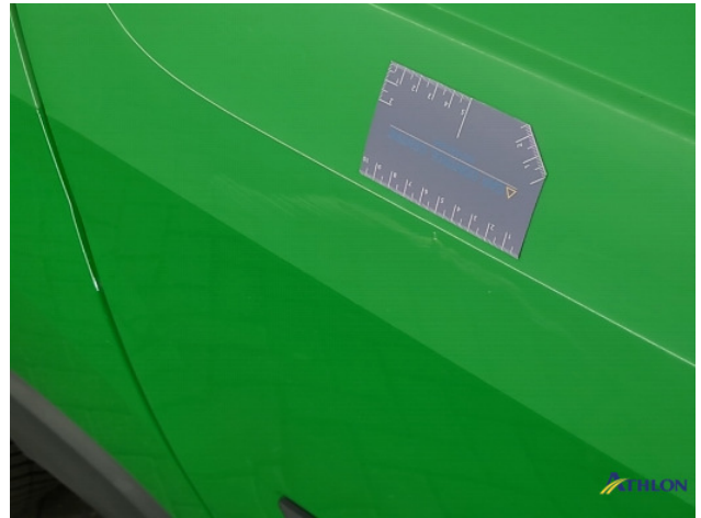
6. diverse Gebruikssporen