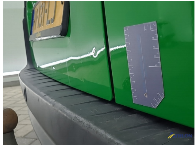
3. Achterklep Deuk/deuken