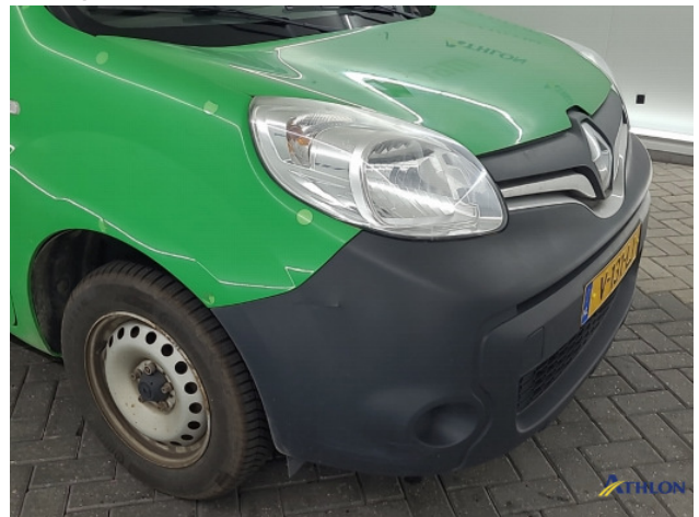
2. Voorbumper Schaafplek