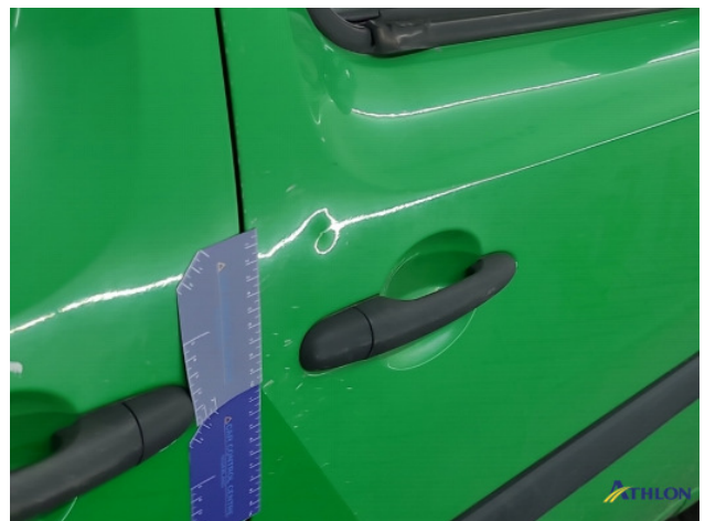
5. Portier voor - rechts Deuk/deuken