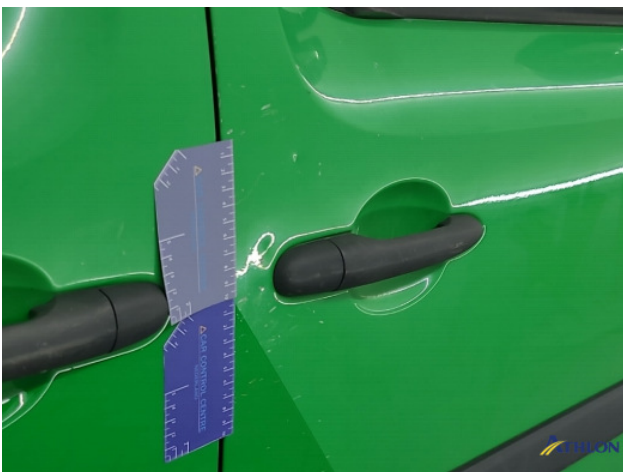
5. Portier voor - rechts Deuk/deuken