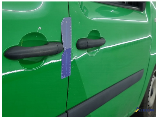
5. Portier voor - rechts Deuk/deuken