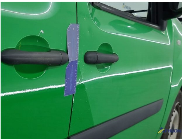
5. Portier voor - rechts Deuk/deuken