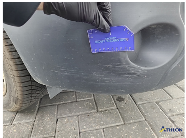
2. Voorbumper Schaafplek