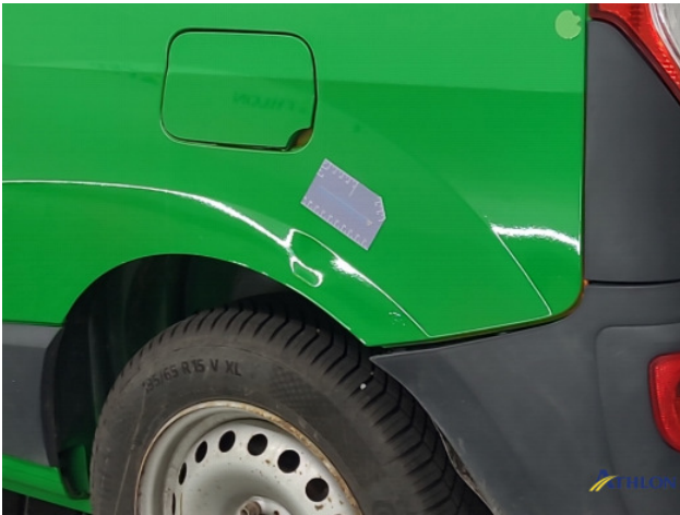
4. Zijwand - achter - Links Deuk/deuken