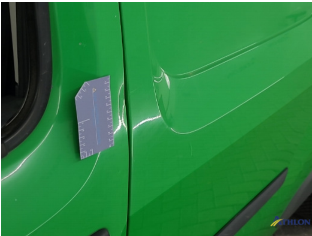
6. diverse Gebruikssporen