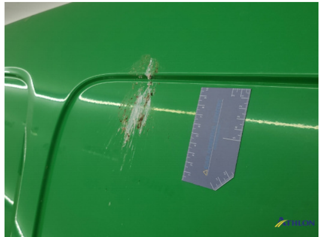
6. diverse Gebruikssporen