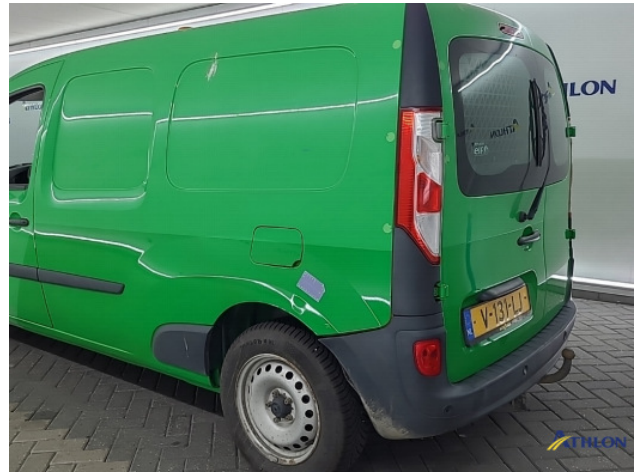
4. Zijwand - achter - Links Deuk/deuken