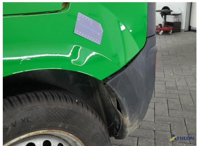
4. Zijwand - achter - Links Deuk/deuken