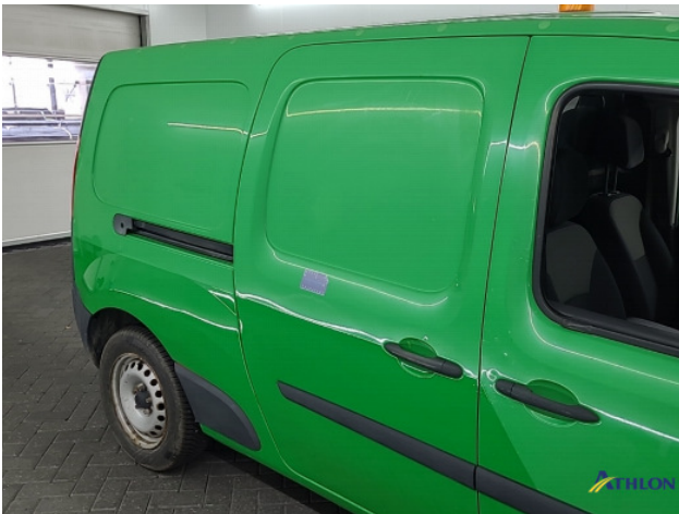
6. diverse Gebruikssporen