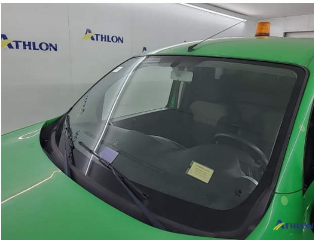
1. Voorruit Breuk / barst / scheur