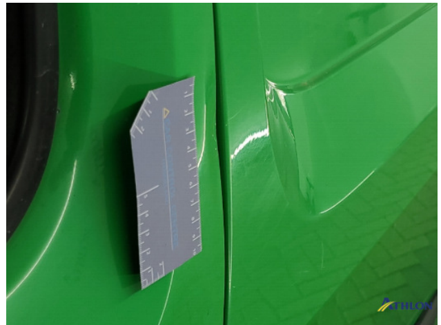
6. diverse Gebruikssporen