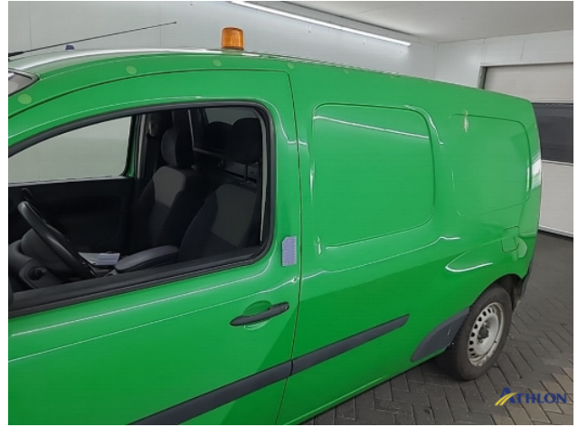
6. diverse Gebruikssporen