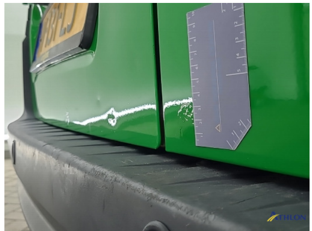
3. Achterklep Deuk/deuken