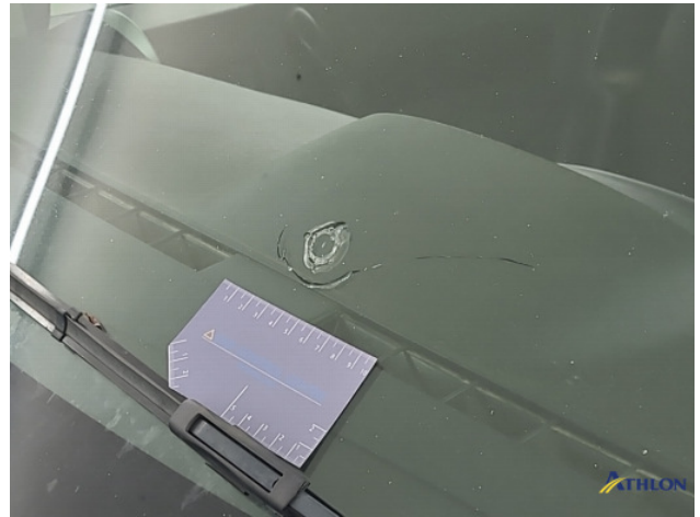
1. Voorruit Breuk / barst / scheur