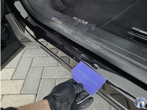
1. diverse Gebruikssporen - Aanvaardbaar