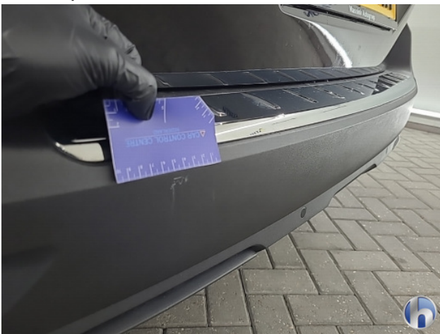
1. diverse Gebruikssporen - Aanvaardbaar