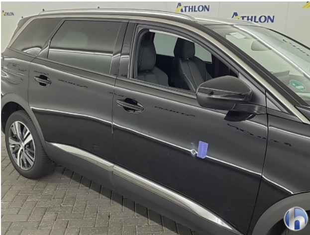
1. diverse Gebruikssporen - Aanvaardbaar