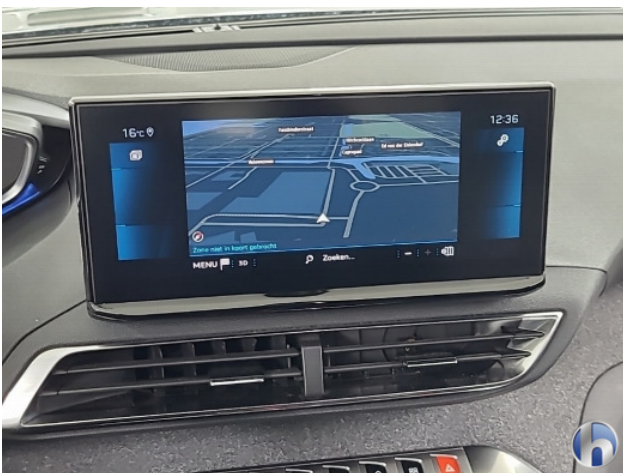
Navigatie of radio