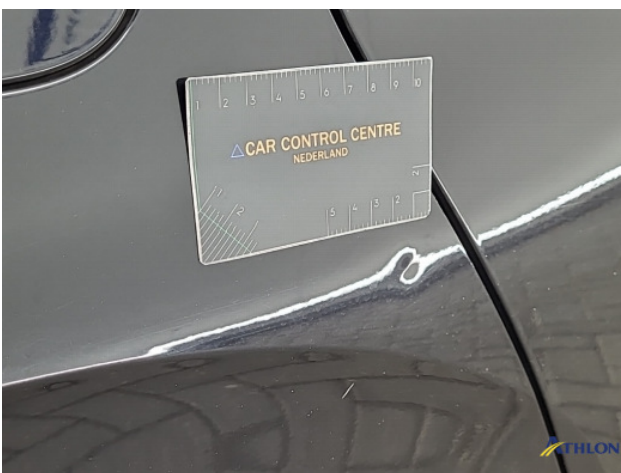
1. diversen Gebruikssporen