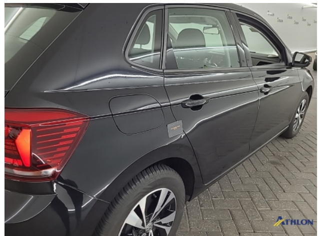
1. diversen Gebruikssporen