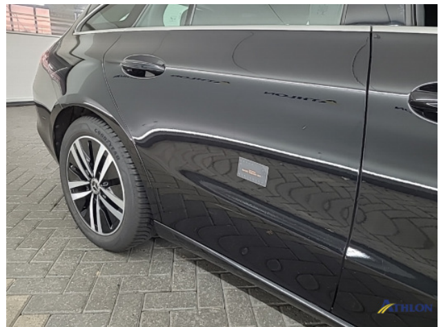
2. Portier achter - rechts Schaafplek