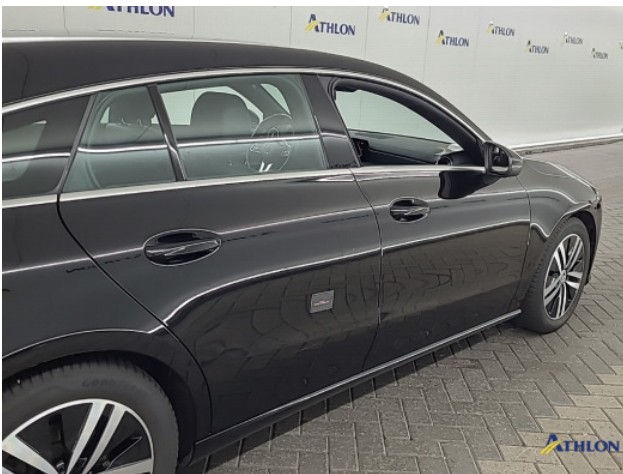
2. Portier achter - rechts Schaafplek