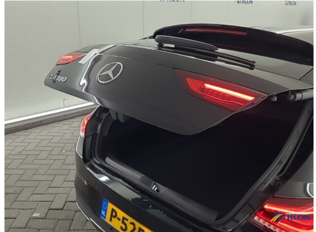
3. Achterklep Gebruikssporen