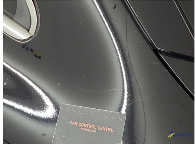
4. Diverse Gebruikssporen