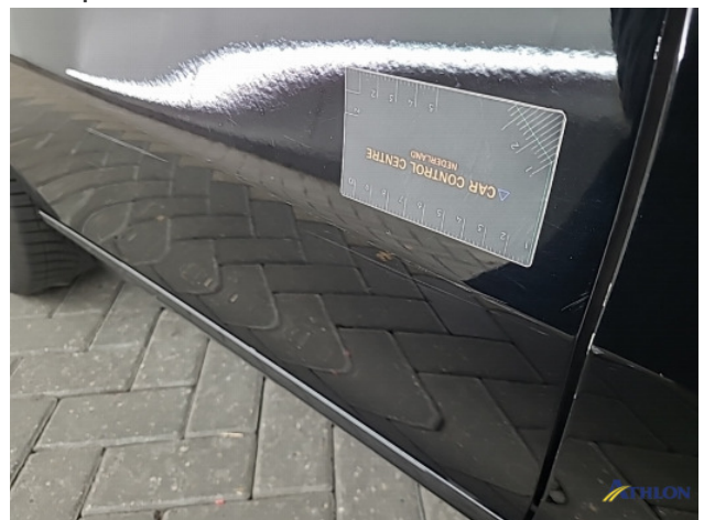
2. Portier achter - rechts Schaafplek