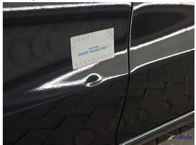
4. Diverse Gebruikssporen