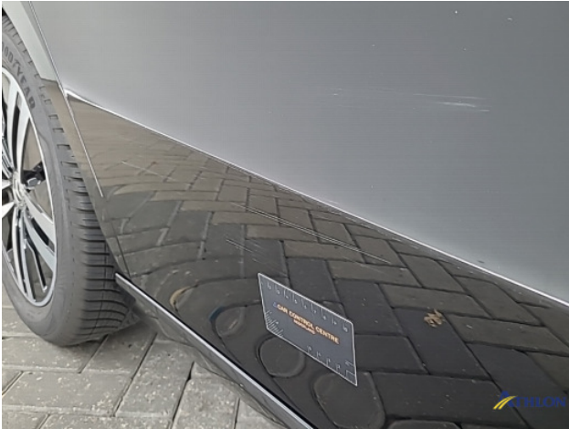
2. Portier achter - rechts Schaafplek