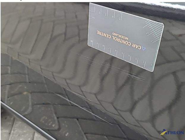
2. Portier achter - rechts Schaafplek