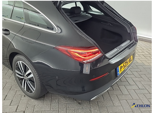
1. Achterbumper Krassen