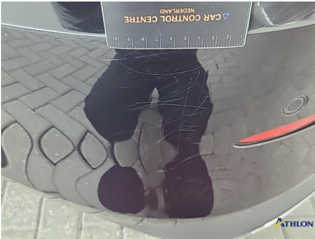
1. Achterbumper Krassen