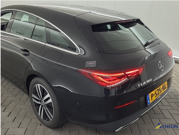
4. Diverse Gebruikssporen