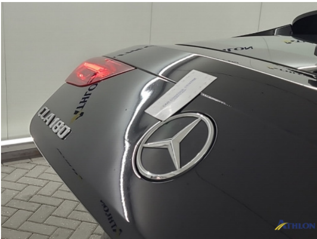
3. Achterklep Gebruikssporen