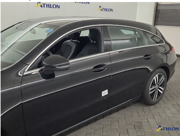
4. Diverse Gebruikssporen