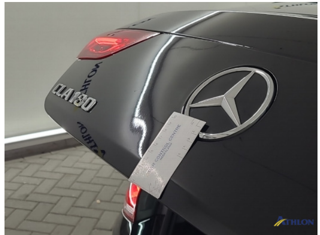
3. Achterklep Gebruikssporen