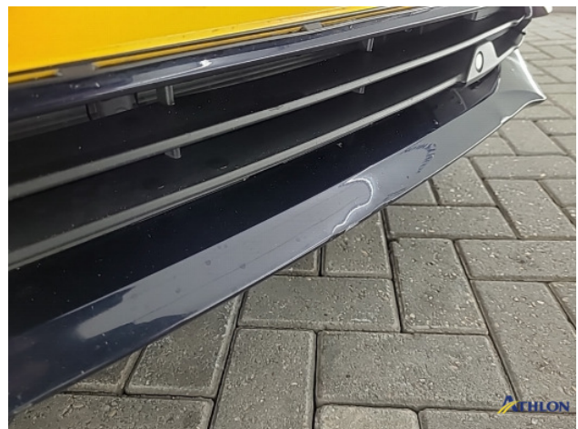
2. Voorspoiler Deuk/deuken