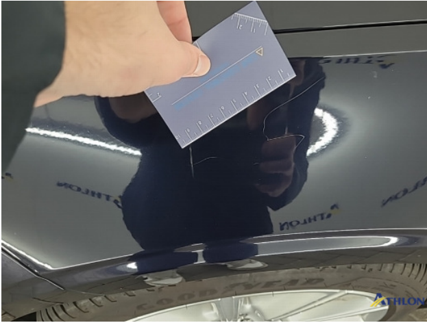
4. Voorscherm - links Krassen