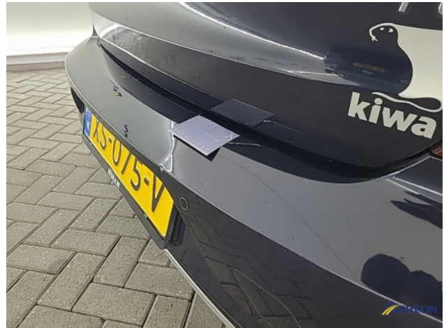
1. Achterbumper Deuk/deuken