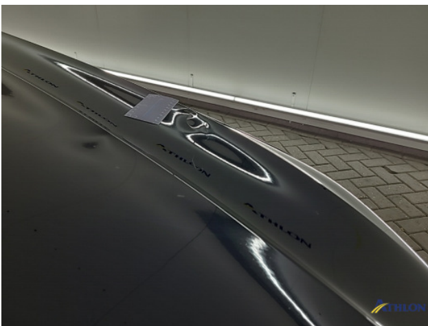
3. Motorkap Deuk/deuken