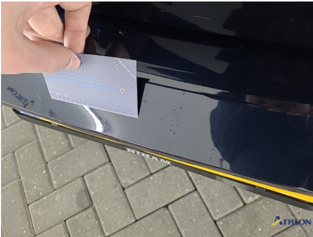
1. Achterbumper Deuk/deuken