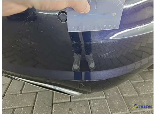
1. Achterbumper Deuk/deuken