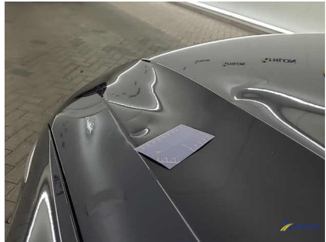
3. Motorkap Deuk/deuken