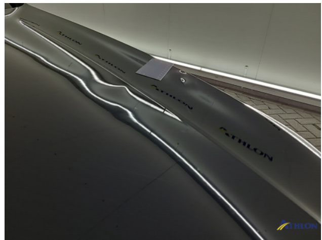
3. Motorkap Deuk/deuken