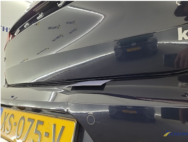
1. Achterbumper Deuk/deuken