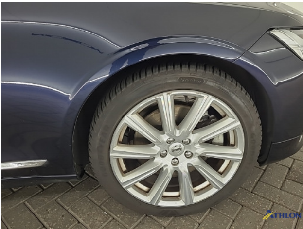
5. diverse Gebruikssporen