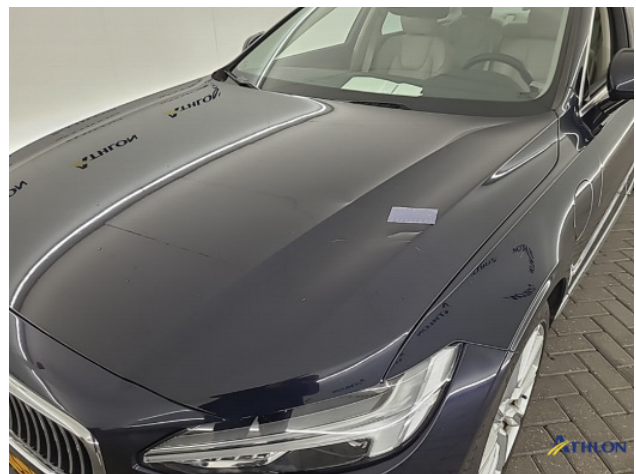
3. Motorkap Deuk/deuken