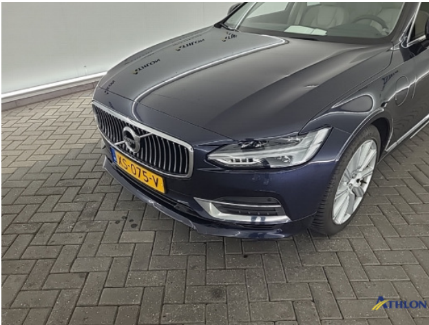
2. Voorspoiler Deuk/deuken