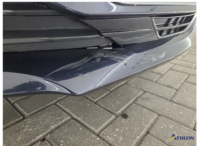
2. Voorspoiler Deuk/deuken