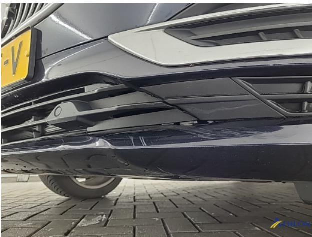
2. Voorspoiler Deuk/deuken