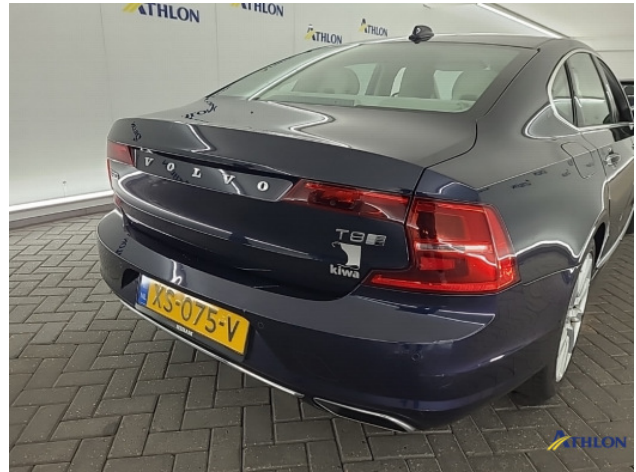
1. Achterbumper Deuk/deuken