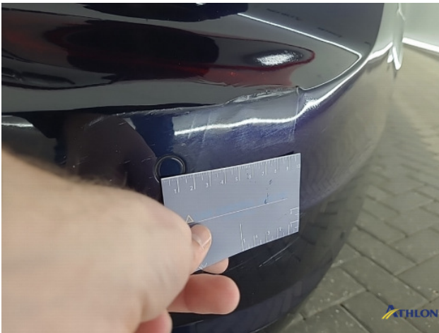
1. Achterbumper Deuk/deuken