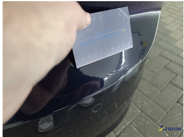
1. Achterbumper Deuk/deuken