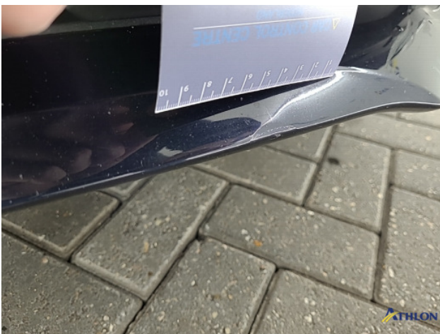
2. Voorspoiler Deuk/deuken