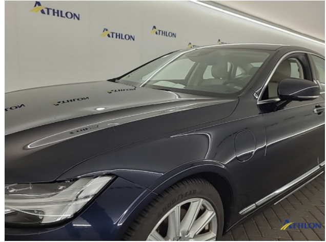
4. Voorscherm - links Krassen