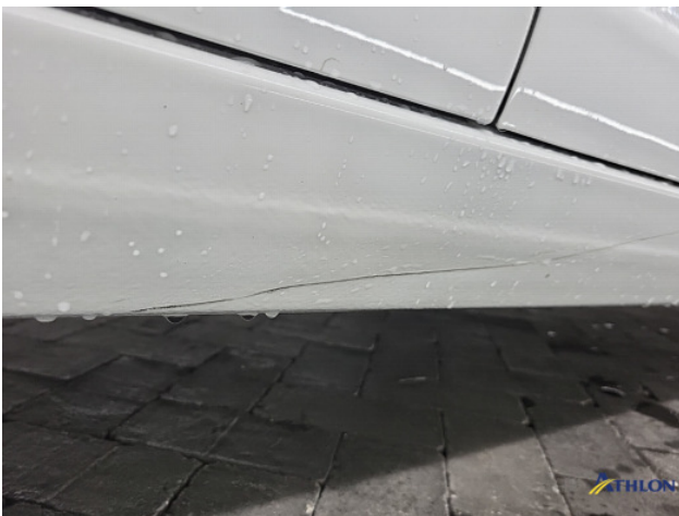
2. Portier voor - rechts Schaafplek