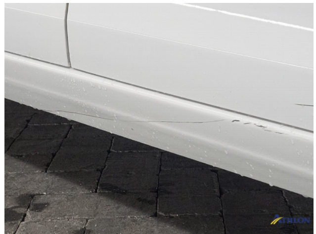
2. Portier voor - rechts Schaafplek