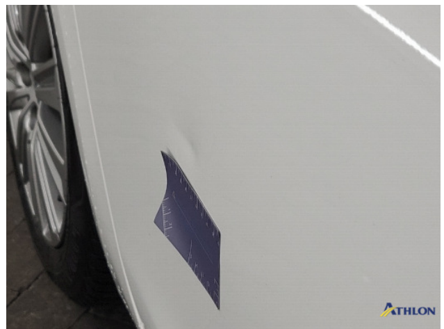
1. Portier achter - rechts Deuk/deuken