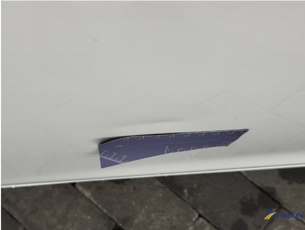
1. Portier achter - rechts Deuk/deuken