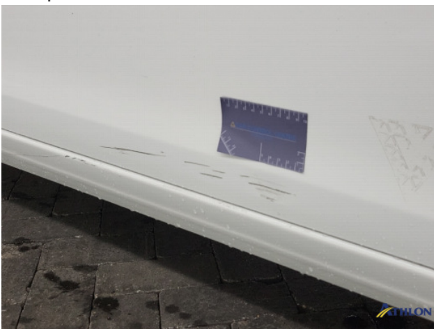
2. Portier voor - rechts Schaafplek