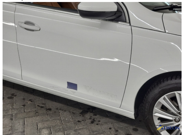
2. Portier voor - rechts Schaafplek