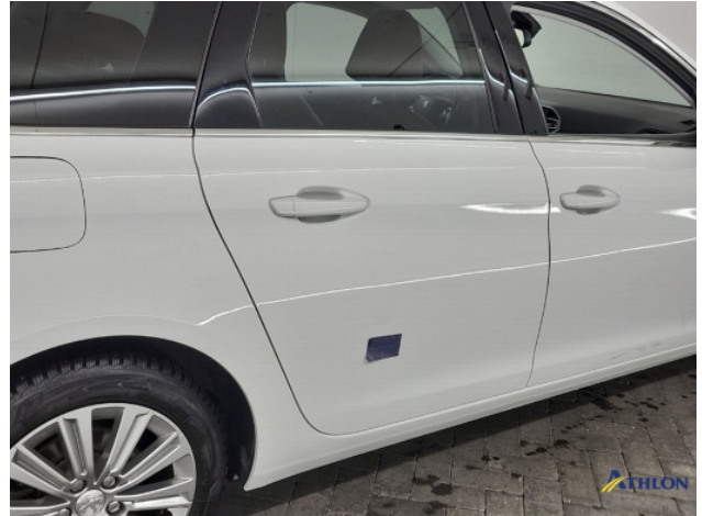
1. Portier achter - rechts Deuk/deuken