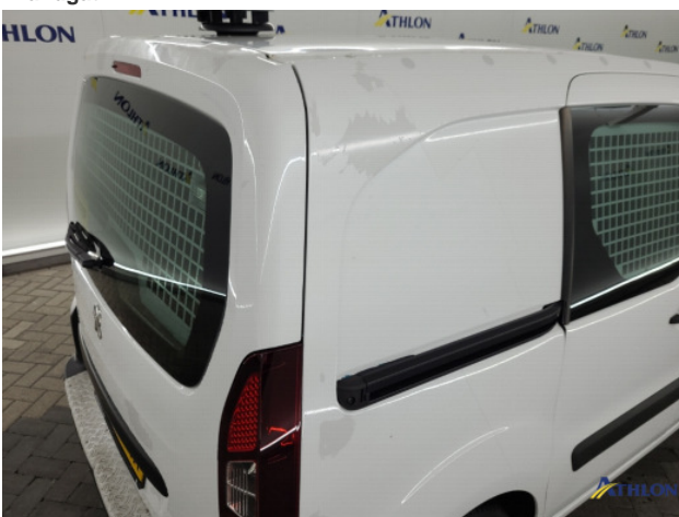
2. Ontstickerresten Gebruikssporen