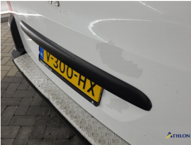
2. Ontstickerresten Gebruikssporen