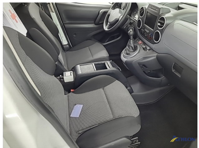
1. Stoel - voor - rechts: zitting Brandgat