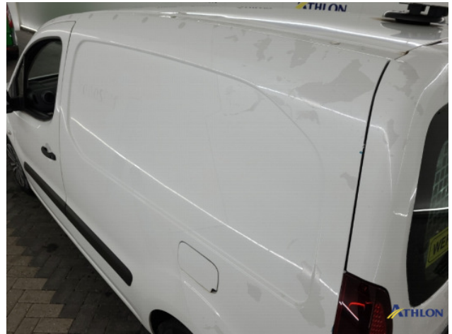
2. Ontstickerresten Gebruikssporen