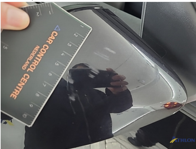
8. Diverse Gebruikssporen