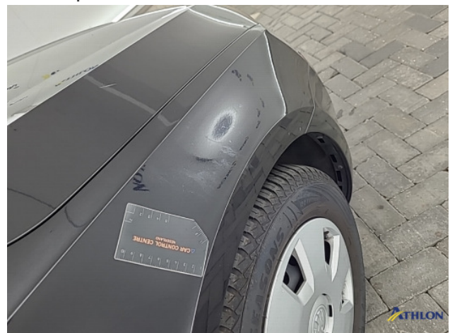
9. Meerdere delen poetsen Gebruikssporen