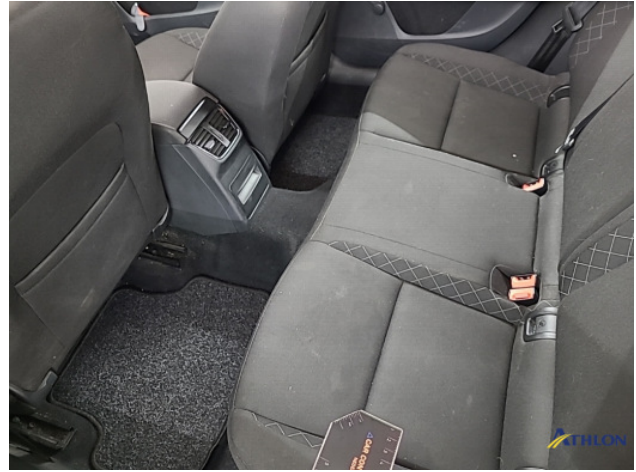
8. Diverse Gebruikssporen