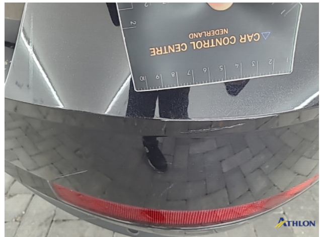
6. Achterbumper Krasen