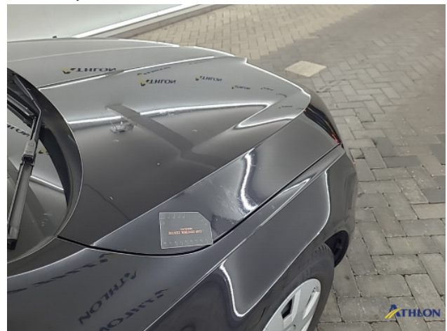
9. Meerdere delen poetsen Gebruikssporen