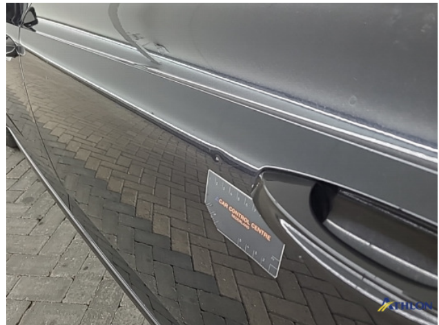
8. Diverse Gebruikssporen