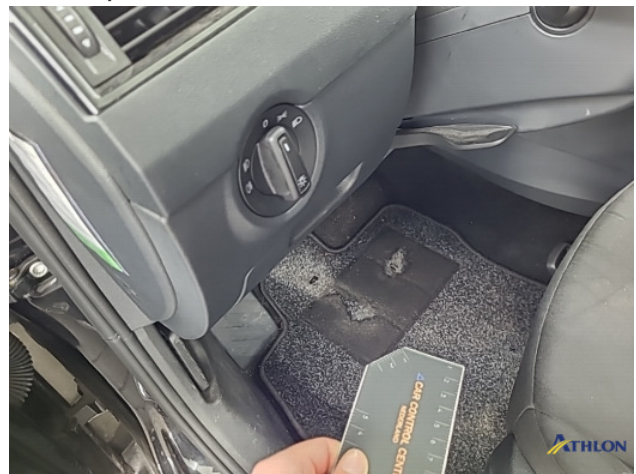
8. Diverse Gebruikssporen