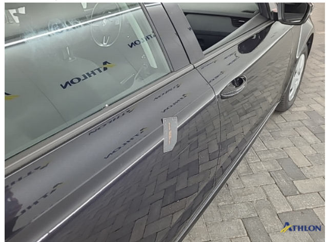
8. Diverse Gebruikssporen