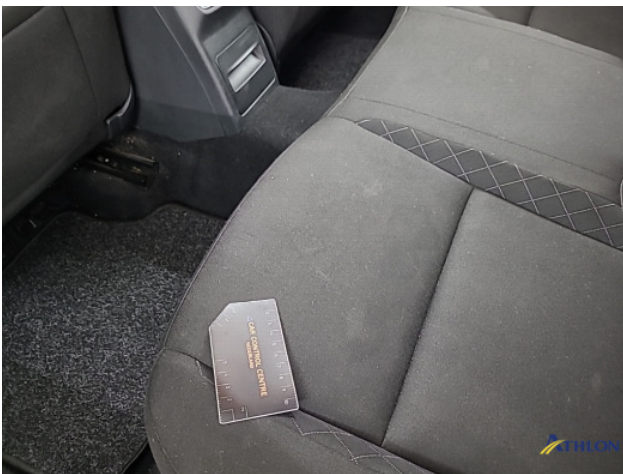
8. Diverse Gebruikssporen