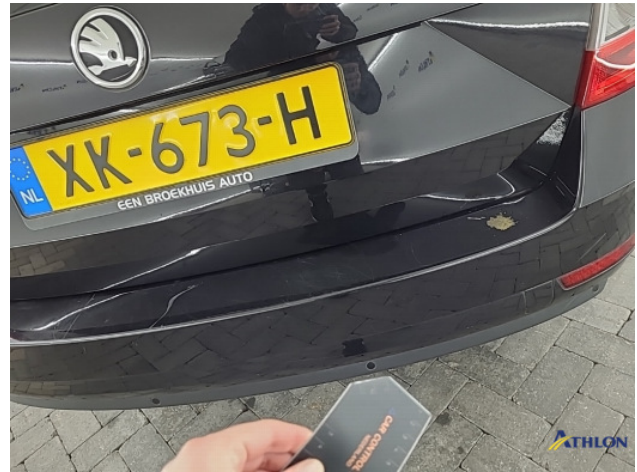
8. Diverse Gebruikssporen