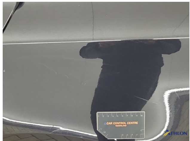
3. Zijwand - achter - Links Deuk/deuken