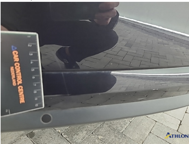
8. Diverse Gebruikssporen