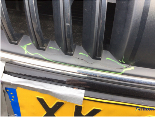
7. Grille boven Breuk / barst / scheur