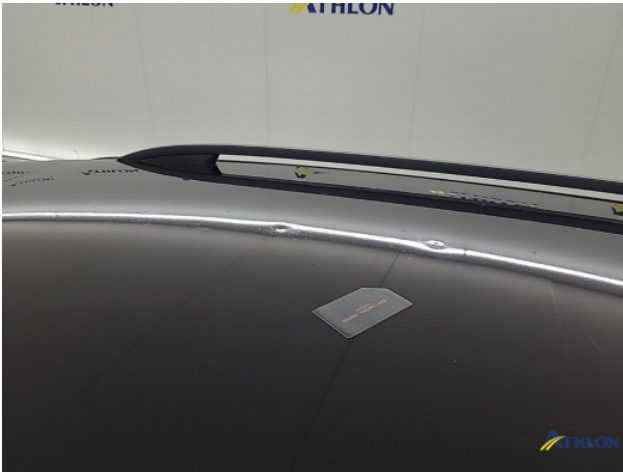
5. Dak Deuk/deuken