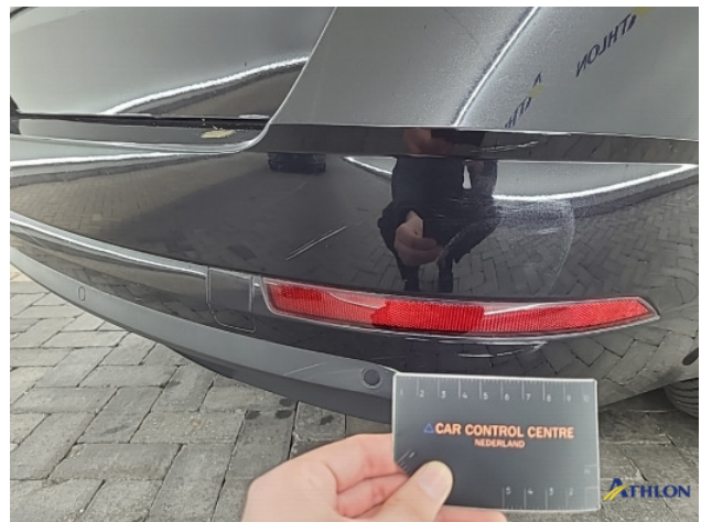
6. Achterbumper Krasen