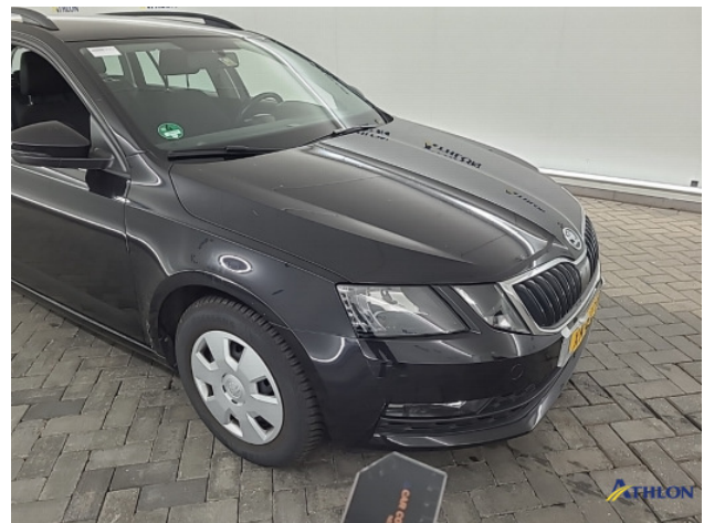
1. Voorbumper Krasen