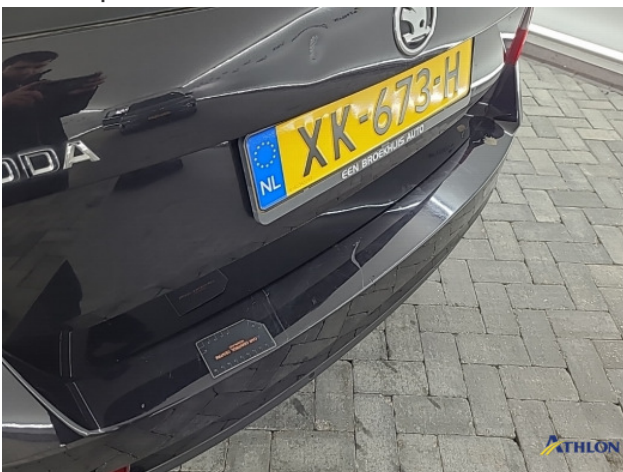
8. Diverse Gebruikssporen