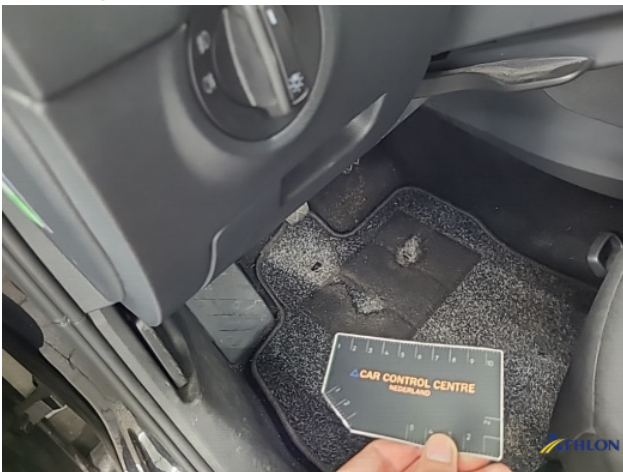
8. Diverse Gebruikssporen