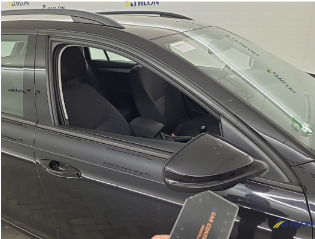
8. Diverse Gebruikssporen