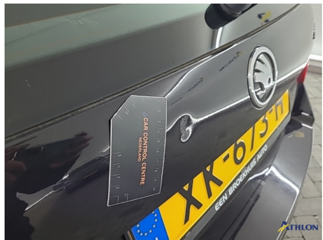
4. Achterklep Deuk/deuken