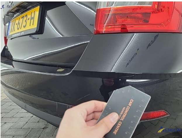
6. Achterbumper Krasen