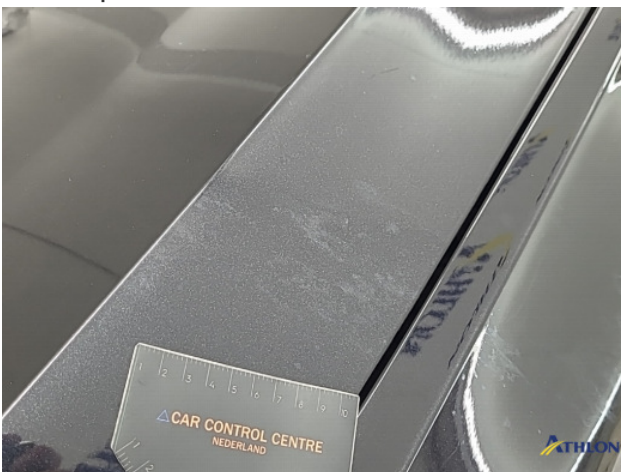
9. Meerdere delen poetsen Gebruikssporen