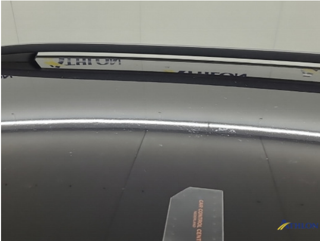
9. Meerdere delen poetsen Gebruikssporen