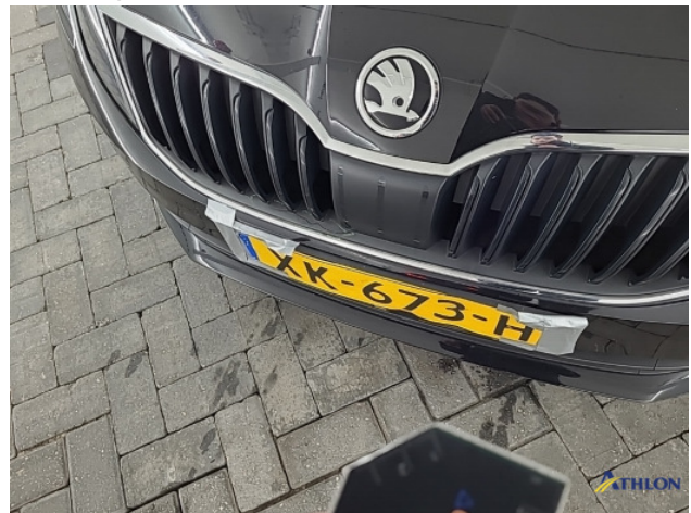
8. Diverse Gebruikssporen