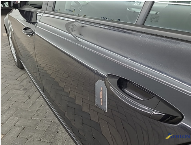
8. Diverse Gebruikssporen