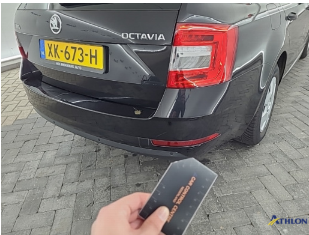
6. Achterbumper Krasen