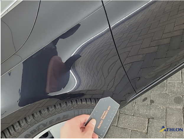
8. Diverse Gebruikssporen