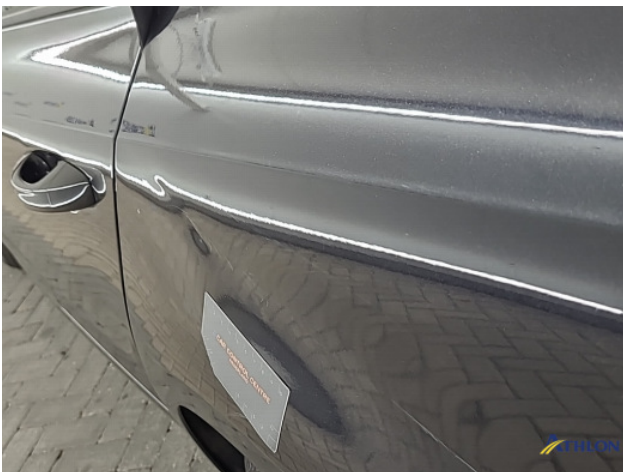
3. Zijwand - achter - Links Deuk/deuken