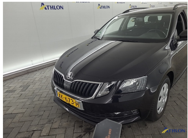
2. Voorbumper Krasen