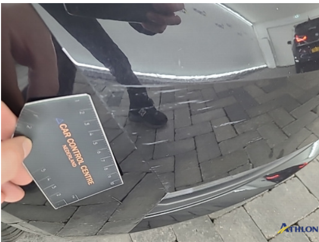
1. Voorbumper Krasen