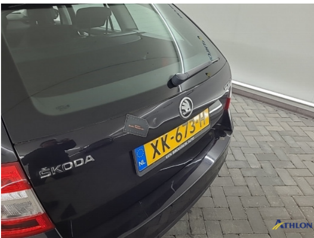
4. Achterklep Deuk/deuken