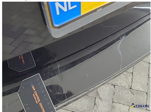
8. Diverse Gebruikssporen