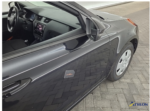
8. Diverse Gebruikssporen