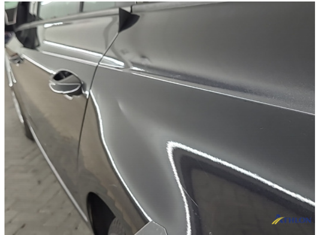
3. Zijwand - achter - Links Deuk/deuken