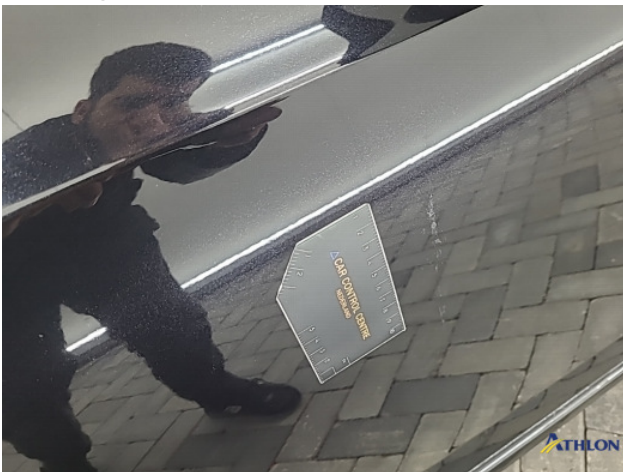
8. Diverse Gebruikssporen