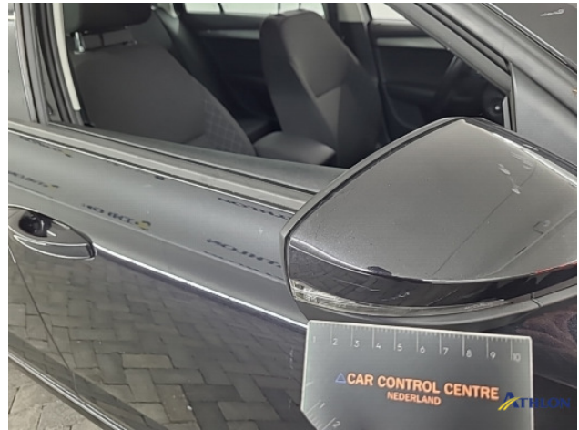
8. Diverse Gebruikssporen