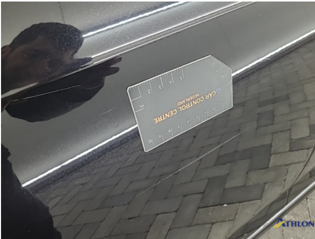
8. Diverse Gebruikssporen