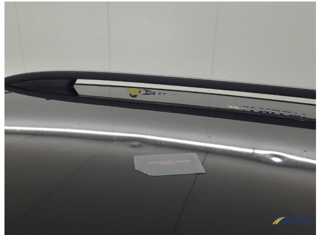
5. Dak Deuk/deuken