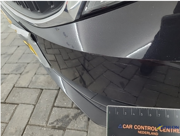
2. Voorbumper Krassen